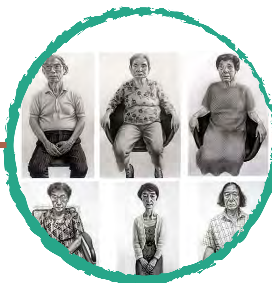
Survivors of the Atomic Bomb, Hiroshima

El Gobierno Japonés emite la " Ley de atención médica para víctimas de bombas atómicas ".