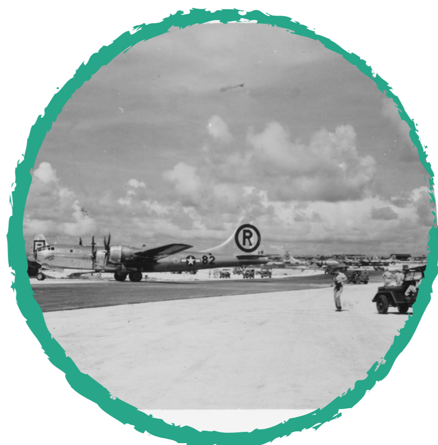
Enola Gay after strike at Hiroshima

Despegan tres bombarderos estadounidenses B-29 de la Isla de Tinian. El bombardero líder "Enola Gay" lleva la bomba nuclear llamada "Little Boy".