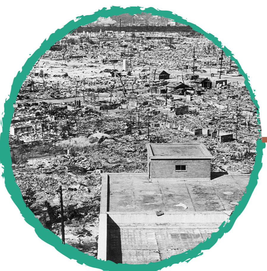
Effects of the atomic bomb on Hiroshima

Se estima que 140.000 personas murieron a causa de la bomba, el 90% del personal médico murió o resultó herido.