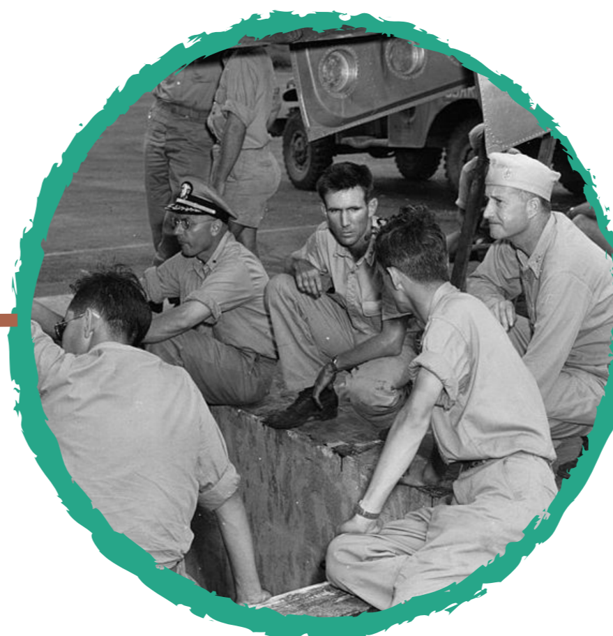
Assembled from the RG-77-BT

La tripulación del bombardero "Enola Gay" arma la bomba.