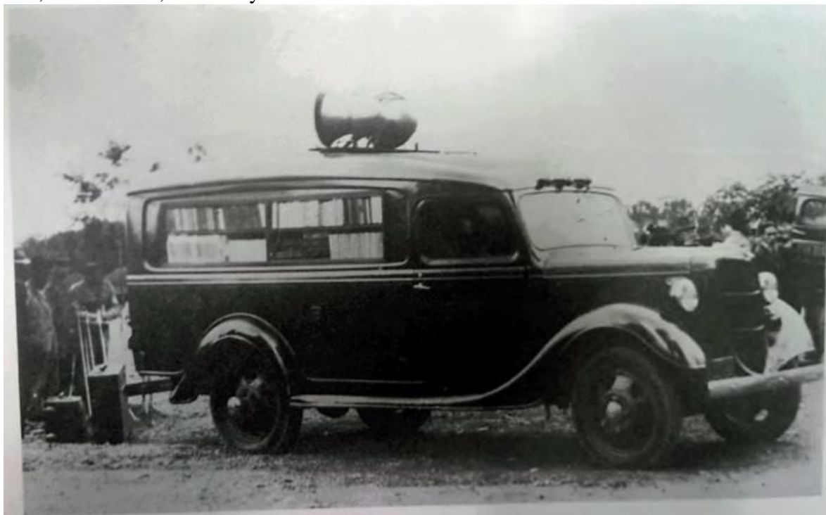
Figura 2: Una biblioteca ambulante perteneciente a la primera sección de las Escuelas Ambulantes. 343

Otra institución creada por Gaitán en 1940 fueron las Escuelas Ambulantes, construidas bajo el mismo principio de sus días en la Universidad Nacional, tenían como objetivo “la difusión, ordenada y armónica de la cultura”. Así, las Escuelas Ambulantes eran básicamente camiones cargados con libros, música y películas que el gobierno consideraba necesarios a las personas de las clases populares 342 . Las Escuelas Ambulantes estaban compuestas por tres secciones: la primera que tenía la cinematografía educativa, la biblioteca, la discoteca y las conferencias culturales; la segunda tenía subdivisiones de higiene social, dentistería, educación física y conferencias de estos temas; por último, la tercera se encargaba de la danza, los orfeones, el teatro y las conferencias relacionadas.