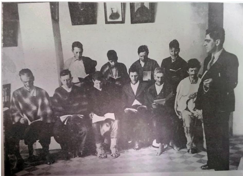
Figura 1: Una escuela de desanalfabetización en Caldas. 335

De la misma forma, instituciones como el Patronato Escolar de Gaitán habían aparecido en Argentina y Perú 336 . En Argentina, se crearon alrededor del país dos tipos de patronatos centrados en la población criminal: el Patronato Nacional de Menores y el Patronato de reclusas. La primera institución fue creada en 1931 y estaba encargada del control de los niños delincuentes tratando de generar estrategias de resocialización 337 . La segunda institución, el Patronato de Reclusas fue originalmente organizado por la Iglesia a finales del siglo XIX en respuesta a que el gobierno le había delegado la función de control de las criminales 338 . En Perú también apareció la figura de los Patronatos, pero centrados en la población indígena como blanco de intervención. En los años veinte, el Estado moderno peruano se constituyó como un marco de exclusión legal hacia lo indígena y el progreso se entendió como un proyecto de mejoramiento racial en el que los indígenas debían transformarse en trabajadores 339 . Así, el Patronato de la Raza Indígena fue creado en 1922 con el objetivo de “reeducar al indígena a la vida legal y cultural para poner fin a su esclavitud” 340 . Por esta razón, en estos patronatos se enseñaban todas las habilidades que se consideraban necesarias para insertar al indígena a la vida de la metrópoli peruana, pues la