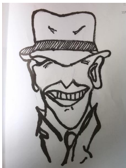
Figura 11. Autorretrato dibujado por Gaitán para el periódico Mundo al día en 1936. 432