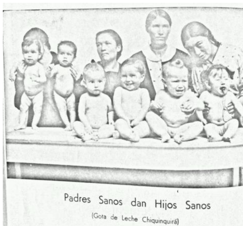
Figura 3: Imagen promocional de la Gota de Leche en 1938 con el mensaje “Padres sanos dan hijos sanos”. 366

Igualmente, la sección de las salas de lactancia también tenía tres centros de protección materna con consultorios pre y pos natal y con restaurantes y refugios maternos 367 . En esencia, se trataba de que el municipio ofreciera protección a las madres de la hostilidad del entorno bogotano, todo para asegurar el futuro de la raza. Desde la teoría biotipológica se había señalado que las madres con algún tipo de anomalía terminarían generando niños con problemas biológicos y morales. Por esto, en Argentina varios médicos, influenciados por la teoría de Pende, trataron de crear biotipos de las mujeres argentinas para advertir cuales serían las más peligrosas para el desarrollo de la raza nacional. Dichos biotipos mezclaban características morales, sexuales y médicas que podían generar diferentes infantes degenerados y enfermos 368 . En ese sentido, tanto en Argentina como en la ciudad de Bogotá se instrumentalizó una idea de la madre como defensora de la raza y agente determinante de la biotipología de la sociedad. Por un lado, en Argentina se trataba de determinar los peligros que podían representar ciertas taxonomías de madres para el desarrollo sano de los niños argentinos. Por otro lado, la perspectiva que se evidencia en la ciudad de Bogotá muestra que el peligro estaba fuera de las madres, en las características del medio social y ambiental de la ciudad. Por esto, la labor del Estado era protegerlas de aquellos riesgos para asegurar un desarrollo seguro del infante.