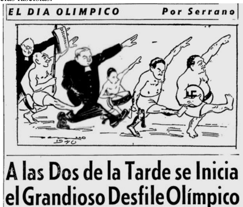
Figura 10. Caricatura desfile olímpico por Serrano en El Tiempo 13 de octubre de 1940.

tenían algunos intelectuales sobre la sociedad colombiana sumamente católica, enferma y peligrosa. Así mismo, señalan, con esto, a Gaitán como un líder populista y con claras tendencias fascistas.