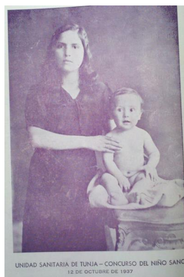
Figura 4: Imagen ganador del Concurso del Niño Sano, 1937.

Estas campañas del Niño Sano eran similares a proyectos que se habían creado en el México posrevolucionario durante los años veinte y treinta. Como lo mencionó Albarrán, el Estado mexicano consolidó en el lenguaje oficial una imagen idealizada del niño saludable, educado e inocente con el objetivo de hacer más eficientes a los futuros ciudadanos 373 . En ese sentido, la salud se convirtió en un objetivo cuantificable haciendo posible crear los Concursos del Niño Sano donde se elegían a los infantes que mejor pudieran representar los objetivos del Estado 374 . Como sucedió en el caso mexicano, las campañas que se realizaron en Colombia