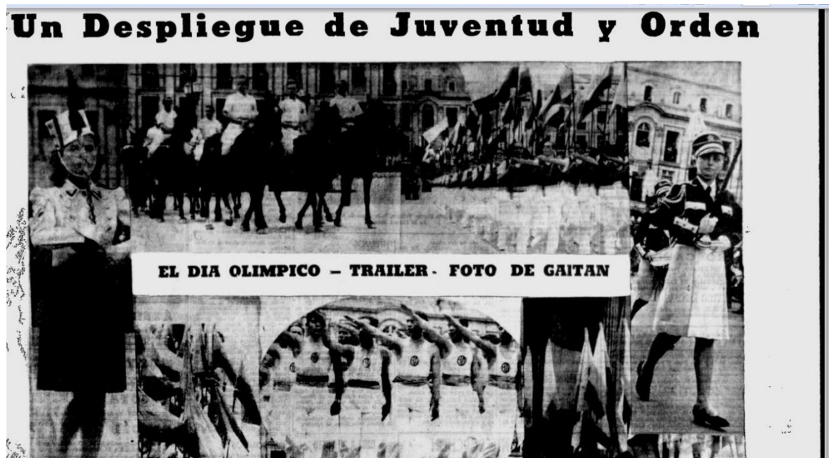
Figura 9. Página especial El Tiempo 13 de octubre de 1940, Un despliegue de juventud y orden.

La presentación del 12 de octubre de 1940 causó algunas reacciones en la prensa que alagó la gran demostración organizada por el Ministro de educación. Como se muestra en la figura 8, en el diario El Tiempo , el titular del día siguiente fue “Maravilloso certamen de orden y disciplina fue el desfile olímpico” acompañado de la imagen de la Plaza de Bolívar llena de estudiantes formados. Así mismo, como se muestra en la figura 9, el diario dedicó una página completa con las fotos del evento hablando de “un despliegue de juventud y orden”. Igualmente, varias personalidades de la vida pública alagaron el esfuerzo de mostrar la transformación de la juventud colombiana.