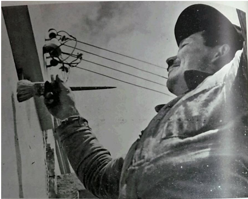
Figura 6: Campañas de embellecimiento de la ciudad. “Un obrero limpia, fija y da esplendor a un arcaico frente urbano” 394

La transformación de la ciudad implicaba un cambio físico, psicológico y social de las clases populares bogotanas. En el documento publicado por la Alcaldía para referenciar sus decretos y acuerdos, se publicaron varias imágenes de obreros trabajando en el embellecimiento de la ciudad. En la figura 6, un hombre, caracterizado como un obrero, le tomaron una foto en contrapicado mientras “limpia, fija y da esplendor a un arcaico frente urbano”, con una expresión de felicidad en su rostro. En ese sentido, la imagen simboliza varias cosas. Por un lado, el contrapicado, la expresión del hombre y su definición como obrero señalan que la labor de transformar la apariencia de su ciudad ennoblece al hombre perteneciente a las clases trabajadoras de la ciudad. Por otro lado, la imagen del obrero que trabaja alegremente para eliminar los rezagos del pasado, resultaba ser apropiada para lo que el Estado solicitaba de los ciudadanos modernos. Por estas razones, la campaña de transformación de la apariencia física de la ciudad se trataba también de una modificación del ciudadano bogotano.