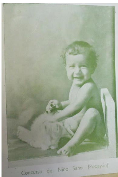
Figura 5: Imagen del ganador del Concurso del Niño Sano, 1938.

El consultorio del Niño Sano hacía parte de la sección de protección infantil del Departamento de Sanidad de la Alcaldía de Bogotá. El objetivo principal de este consultorio era analizar las condiciones de salud de los niños de las clases populares. Específicamente, tenían consultorios en dietética y en higiene 369 . Otro ejemplo de la importancia que Gaitán le dio a la salud infantil fue la “semana de los niños” celebrada del 15 al 21 de noviembre de 1936. En esta semana se llevaron a cabo varios programas centrados en los infantes en los que se regalaban canastas de frutas y ropa donadas por la ciudadanía 370 . Así mismo, las campañas creadas bajo la idea del Niño Sano no solo tuvieron acogida en la Alcaldía de Gaitán, sino también a nivel nacional. En 1937, el Departamento Nacional de Higiene comenzó a realizar unos concursos para elegir a los niños más sanos de cada población, al ganador se le ofrecía una subvención del Estado para el sostenimiento del niño 371 . Igualmente, los empleados del Estado visitaban cada año a los ganadores para asegurarse de que las madres mantuvieran la salud de sus hijos con el dinero y que no lo desperdiciaran 372 .