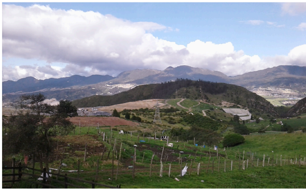
Figura 1. Vista desde el salón de clase 1-B, Colegio Rural Mochuelo Alto

1 Corregimiento departamental: es una división del departamento, la cual incluye un núcleo de población. Según esta misma norma, los ahora corregimientos departamentales no forman parte de un determinado municipio. De conformidad con el Decreto 2274 de 1991 (octubre 4). Instituto Geográfico Agustín Codazzi. https://www.igac.gov.co/es/contenido/areas-estrategicas/fronteras-y-limites-de-entidades-territoriales