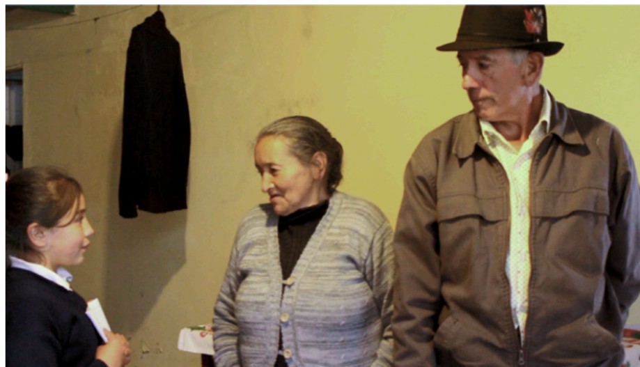
Figura 4. Ejercicio de entrevistas por parte de estudiantes del Colegio Rural Mochuelo Alto a vecinos y vecinas de la comunidad de la vereda Mochuelo Alto