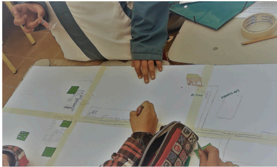
Figura 7. Mapeo de la vereda Mochuelo Alto con estudiantes

La vereda Mochuelo presenta riesgo antrópico y contaminación atmosférica, debido a la explotación de canteras, chimeneas de industria, mataderos clandestinos y el Relleno Sanitario Doña Juana, todo lo cual puede generar material particulado y gases además de olores ofensivos (p. 61).