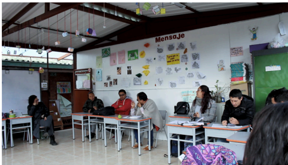
Figura 9. Mesas de trabajo

Nota: taller con maestras y maestros del Colegio Rural Mochuelo Alto sobre representaciones de la escuela como territorio desde lo subjetivo y lo colectivo (2019).