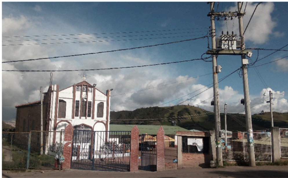
Figura 2. Entrada al Colegio Rural Mochuelo Alto, iglesia y salón comunal