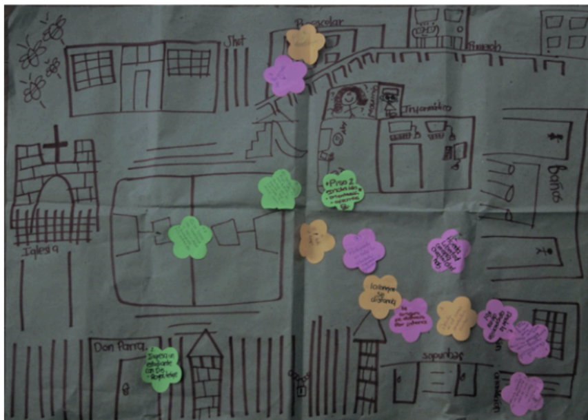
Figura 6. Mapeo de la institución educativa rural

Nota: taller con maestras y maestros del Colegio Rural Mochuelo Alto, sobre representaciones de la escuela como territorio desde lo subjetivo y lo colectivo (2019).