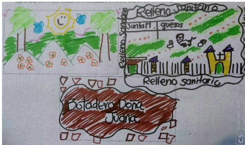
Figura 5. Muestra ejercicio de representación

Nota: taller con maestras y maestros del Colegio Rural Mochuelo Alto, sobre representaciones de la escuela como territorio desde lo subjetivo y lo colectivo (2019). Fuente: elaboración propia.