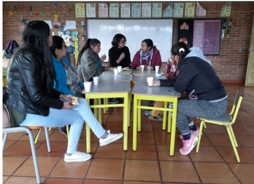
Figura 3. Mesa de trabajo territorial

Al planear el análisis se tuvo en cuenta todo lo desarrollado en el trabajo de campo (figura 3) y la literatura que comprendía los conceptos de espacio, territorio, territorialidad, desterritorialización, conceptos y experiencias de resistencia, miradas y políticas de la educación rural en Colombia, monografías, artículos e investigaciones desarrolladas sobre Mochuelo Alto y de la comprensión del concepto de la escuela rural obtenido del cruce o