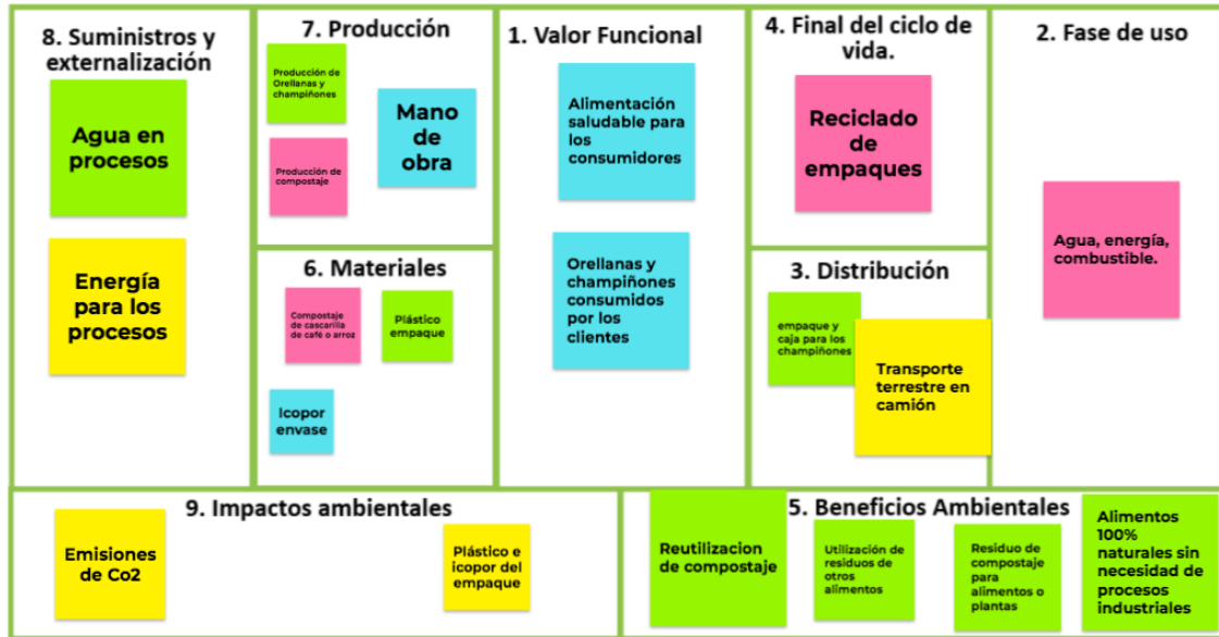
Ilustración 4 - CANVAS ambiental.