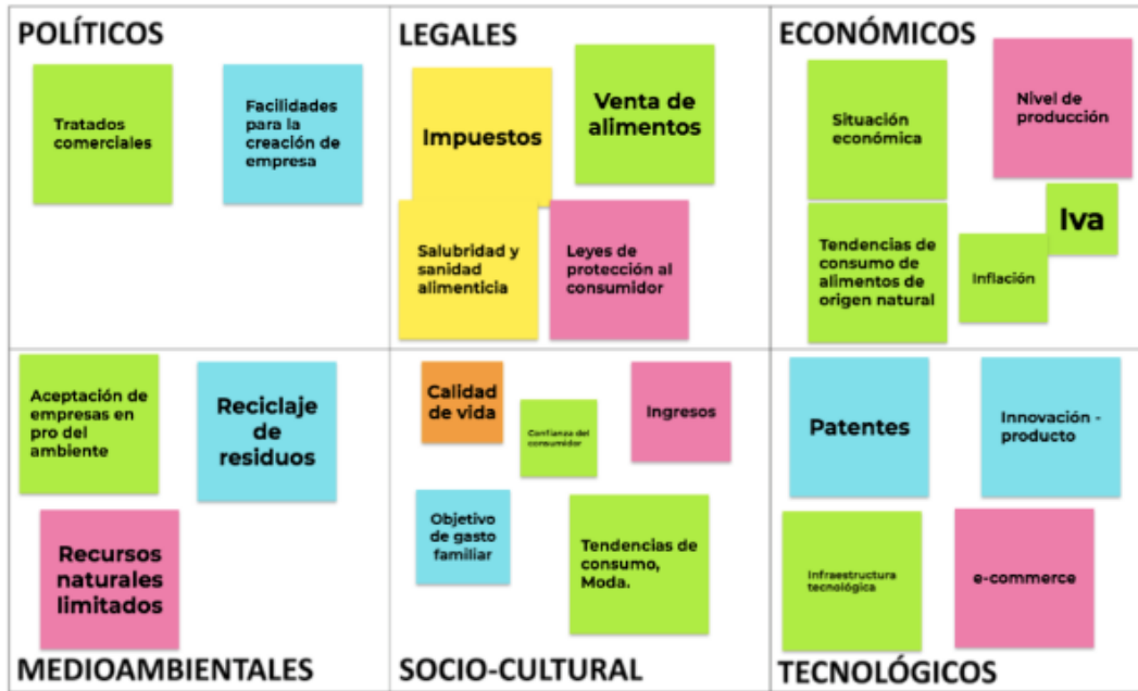
Ilustración 5- PESTEL.