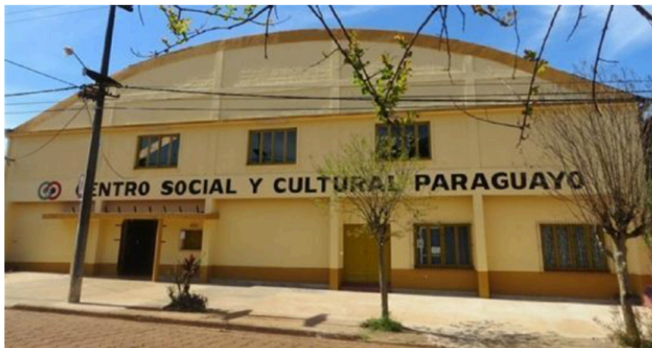
Figura 4. Edificio del CSCP en el centro de la ciudad