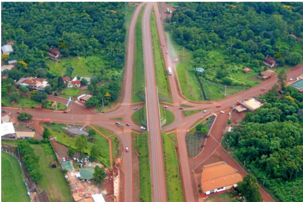
Figura 2. Infraestructura de rutas que atraviesan la ciudad