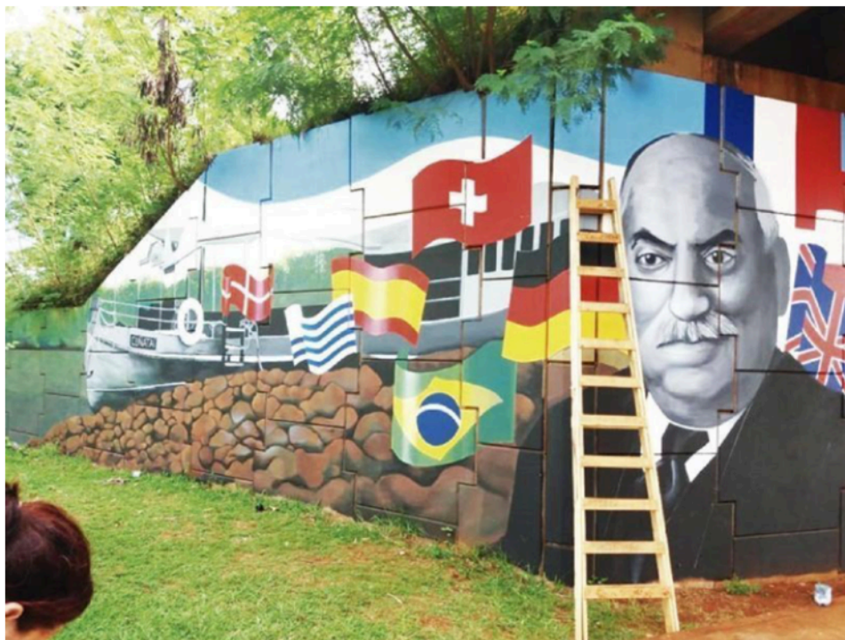
Figura 3. Mural por los 100 años de la fundación de Eldorado

5 En Eldorado, las migraciones limítrofes coexistieron con aquellas de ultramar en el contexto de una política estatal de atracción de migración del norte de Europa. La Ley de Inmigración y Colonización que el presidente Nicolás Avellaneda promulgó en 1876 pretendía que los migrantes y hacendados europeos vinieran a “poblar” y “civilizar” el territorio, desconociendo los contactos culturales preexistentes con comunidades indígenas y migrantes limítrofes.