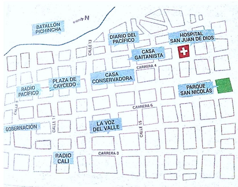
Mapa1: Centro de Cali, 1948 38 .