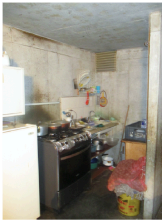
Figura 2. Cocina en obra gris, Metro Usme 136

La imposibilidad de transformar los apartamentos en función de la evolución de los hogares, puede dar lugar a situaciones de hacinamiento crítico observadas en varias de las viviendas visitadas (figura 3). Los habitantes deben entonces adaptarse a la disposición arquitectónica de los espacios domésticos. Por ejemplo, Estaban, que vive en Metro Usme 136, despliega un colchón en la sala de estar para dormir allí por la noche, mientras las otras seis personas se comparten las dos habitaciones.