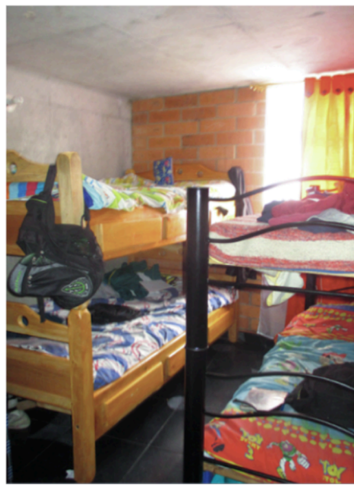
Figura 3. Situación de hacinamiento, Metro Usme 136

Un ejemplo de estrategias de elusión de las normas y prohibiciones propias del régimen de propiedad horizontal es el desarrollo de actividades productivas dentro de la vivienda, una práctica característica de los sectores populares. Se encuentran, entre otros, micro peluquerías, talleres de costura e incluso cibercafé dentro de