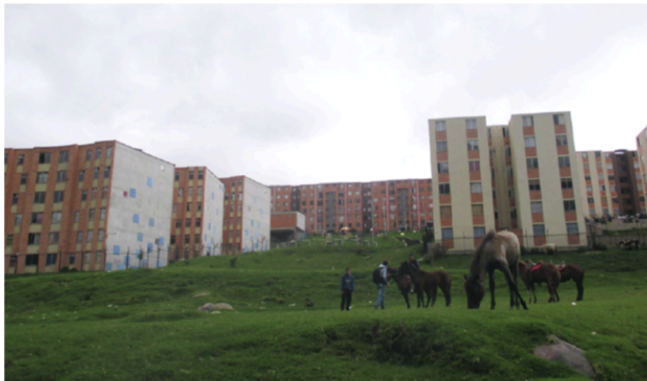
Figura 7. Jóvenes del pueblo con sus caballos