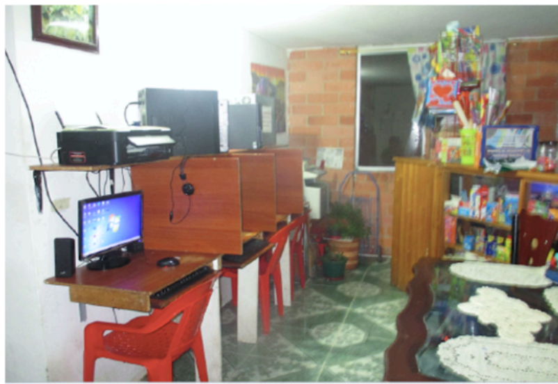
Figura 4. Cibercafé en un apartamento de Metro Usme 136

Finalmente, a menos de cinco años de su entrega, estos apartamentos aparecen como espacios “híbridos” y “multifuncionales” (Santamaría, 2008), resultado de una doble dinámica de apropiación, a través de la transformación material, por un lado, y del desvío de los usos previstos para estos espacios, por otro. Estos procesos ponen de relieve una reproducción de los modos de vida característicos de los sectores populares. Esta “informalización” (Ferme, 2012) de los espacios diseñados y producidos por los promotores va más allá de los límites de la esfera doméstica, para extenderse hacia los