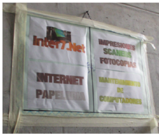
Figura 5. Aviso en los espacios comunes de Metro Usme 136

Dentro de los conjuntos estudiados, aparte de la venta ocasional de algunas verduras por parte de los ancianos, no se identifican apropiaciones de los espacios comunes para un uso comercial. Los pocos puestos informales de este sector están ubicados en el espacio público, en las aceras de la calle principal que conecta los diferentes conjuntos. Si la apropiación de este espacio puede percibirse como