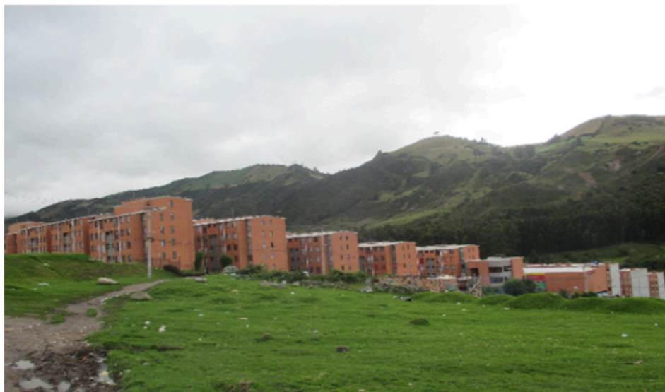
Figura 8. Proximidad de la Ciudadela con paisajes naturales