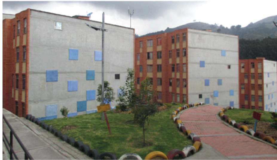
Figura 6. Embellecimiento del conjunto Metro Usme 136 por los residentes (bordes y árboles)