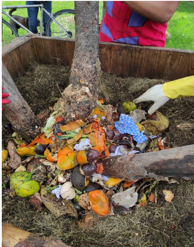
Imagen 7: Contenido de la Paca Digestora. Julio 2021.

- como se puede observar en la imagen 6, se lleven residuos o no (Nota de campo, junio 16 de 2021).