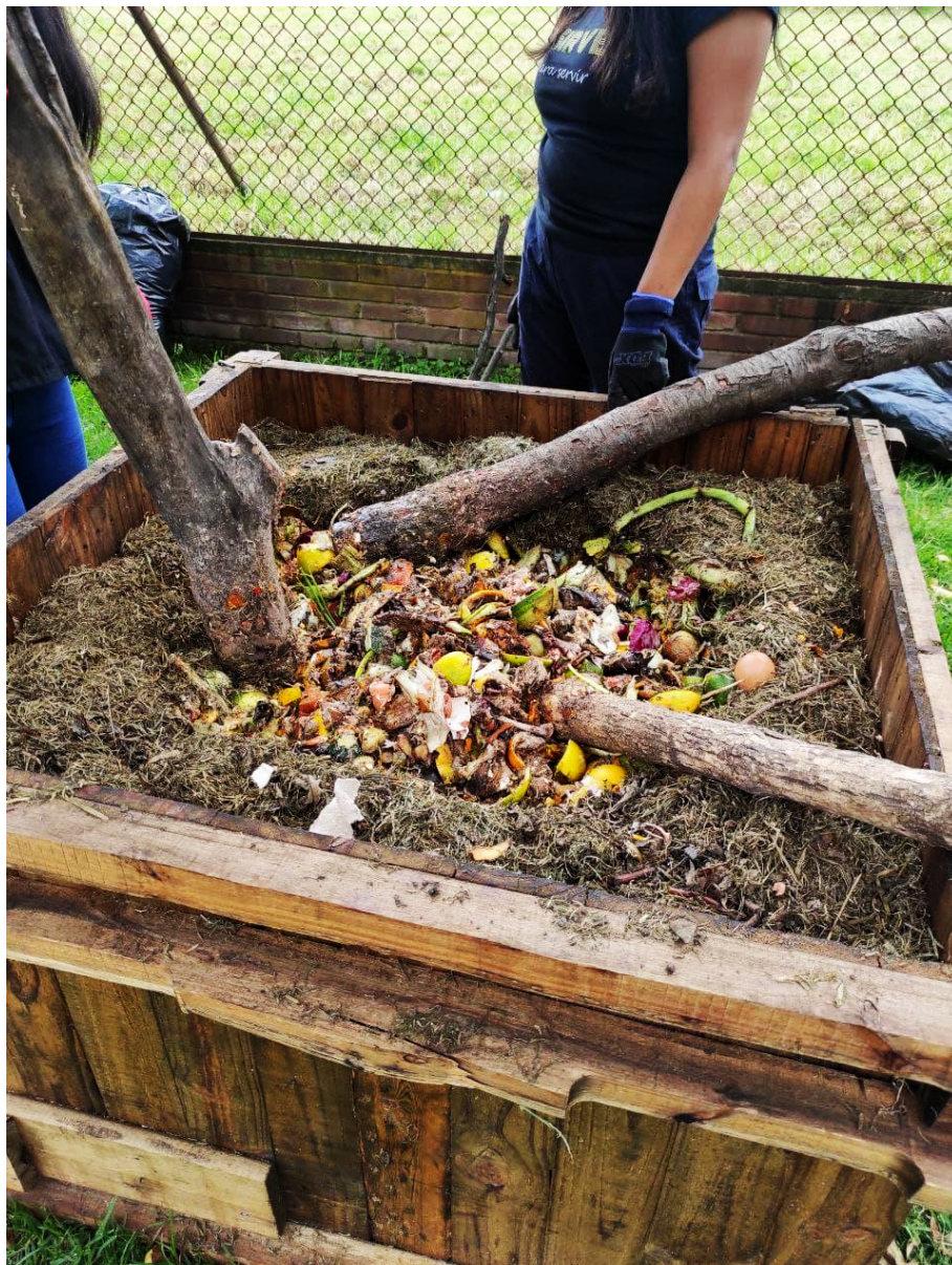
Imagen 2. Realización de la Paca Digestora Silva.

La Paca es realizada por medio de un molde de un metro por un metro, con alturas entre 40 y 80 centímetros. En este molde debe ser de madera o algún otro material sólido y fuerte para soportar la presión ejercida en los residuos para su correcta compactación. En un primer momento, la Paca debe ser realizada sobre pasto o tierra, pues los líquidos residuales que produce son filtrados hacia el suelo. Posteriormente, en una primera capa deben ubicarse ramas que permitan separar los residuos de la humedad del suelo, y filtrar los líquidos que salen de la paca, como se puede observar en la imagen 1. Sobre estas ramas se han de ubicar una primera capa de residuos verdes para evitar el encuentro de residuos alimenticios y el aire, para evitar la pudrición.