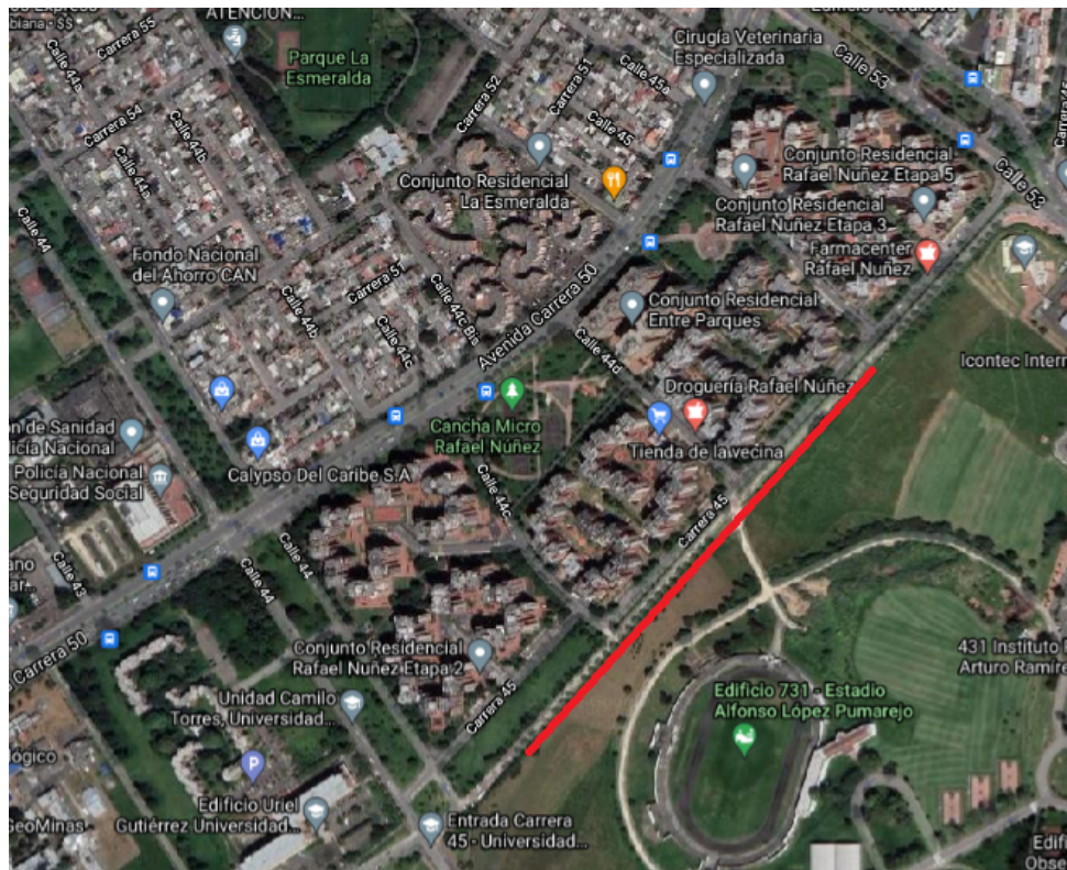
Imagen 4. Vista satelital del barrio Rafael Núñez.

El grupo paquero del barrio Rafael Núñez, cuenta con aproximadamente 40 miembros activos durante el periodo de investigación. Geográficamente, el barrio se extiende por una distancia de 800 metros, en la cual colinda con la Universidad Nacional, cuyo borde aprovechan para realizar las Pacas Digestoras y siembra de árboles nativos. Este espacio es resaltado con una línea roja en la imagen 4. Este límite con la Universidad tiene un espacio verde de aproximadamente 3 metros de profundidad que, asimismo, limita con una “calle” semi pavimentada -que se inunda constantemente- como se puede apreciar en la imagen 5 7 . Esta área, aunque no está ubicada en el “centro” del barrio, es el lugar de reunión y práctica que han utilizado los paqueros en los últimos dos años, y cuyo propósito se ha transformado profundamente; pues ha pasado de un “botadero” de escombros, a un espacio significativo para la población.