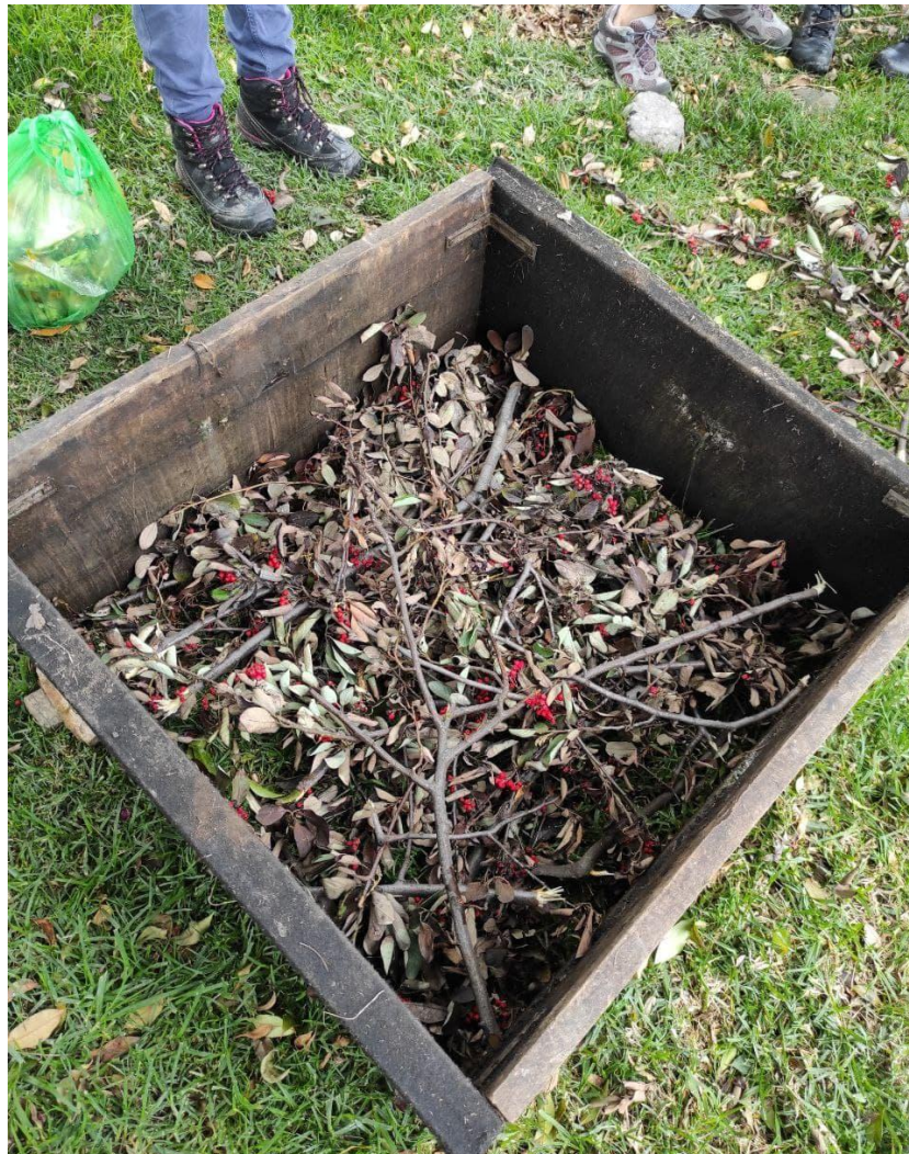
Imagen 1. Primera capa del molde en el barrio Rafael Núñez.

Por tanto, para narrar el proceso de invención de la Paca Digestora es necesario explicar a profundidad en qué consiste y cómo se realiza. Este método de descontaminación consta de prensar los residuos generando un cierre anaeróbico que evita la pudrición de los residuos orgánicos que se depositan en ella. Este sistema de procesamiento resulta en un proceso de fermentación natural que produce alcohol y ácido acético que descontaminan la “basura” y se evaporan en el aire sin producir las cantidades de gas metano o lixiviados que se presentan con el desecho en rellenos sanitarios. (Silva, 2018) Este se realiza en un metro cúbico, que permite compactar alrededor de 500 kilogramos de residuos; reuniendo 250 kg de residuos de cocina, jardín, etc. Y 250 kg de residuos verdes, como pasto u hojarasca. Una vez prensada y terminada ésta opera como un procesador autónomo, con bacterias, hongos y artrópodos nativos, sin necesidad de infraestructura o mantenimiento. (Silva, 2018)