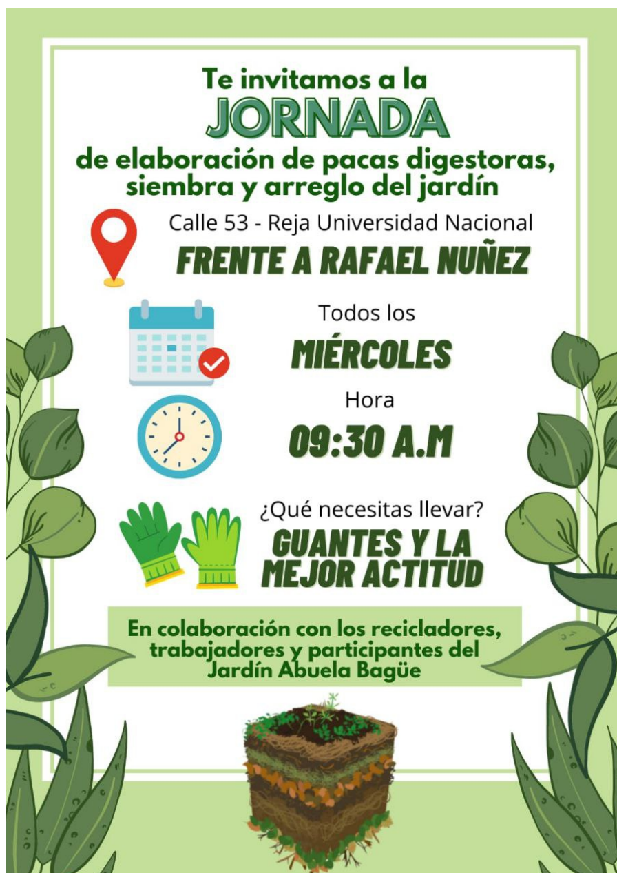
Imagen 8: Invitación a jornada paquera de miércoles. Realizado por el grupo paquero del barrio Rafael Núñez.