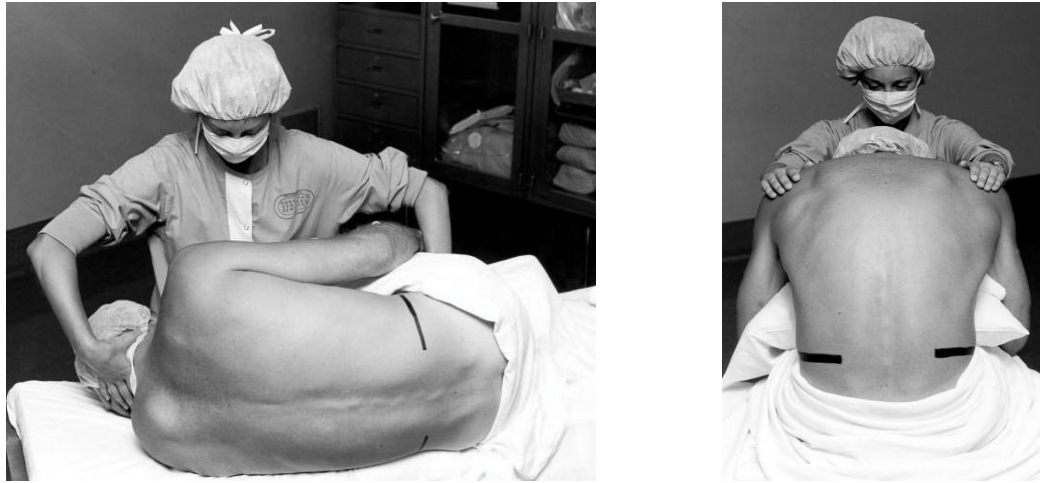
Figura 2. Posición para anestesia espinal decúbito lateral izquierdo (a) y sentado (b).