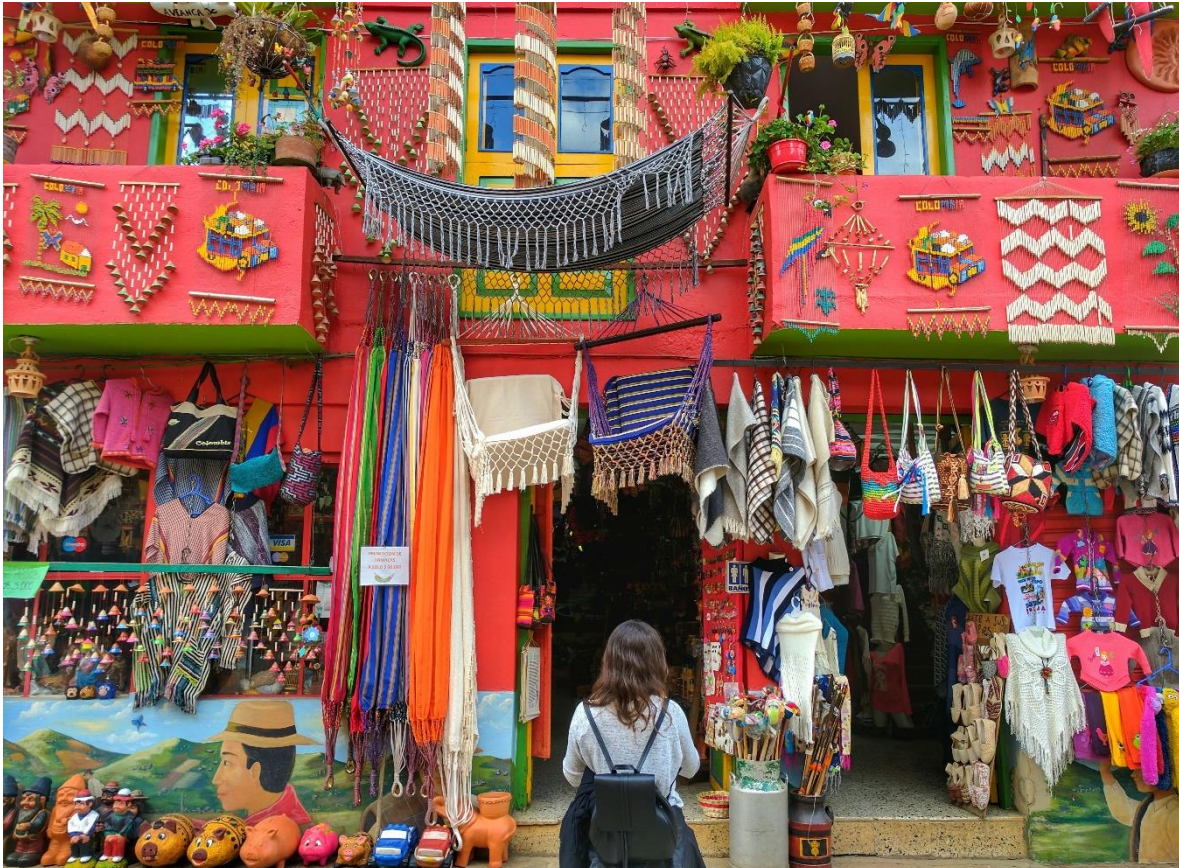
El turismo puede brindar grandes oportunidades al sector del emprendimiento en las regiones.

enero sus pretemporadas en Antioquia, Caldas, Boyacá y Cundinamarca 5 acompañados de servicios turísticos especializados liderados por emprendedores colombianos.