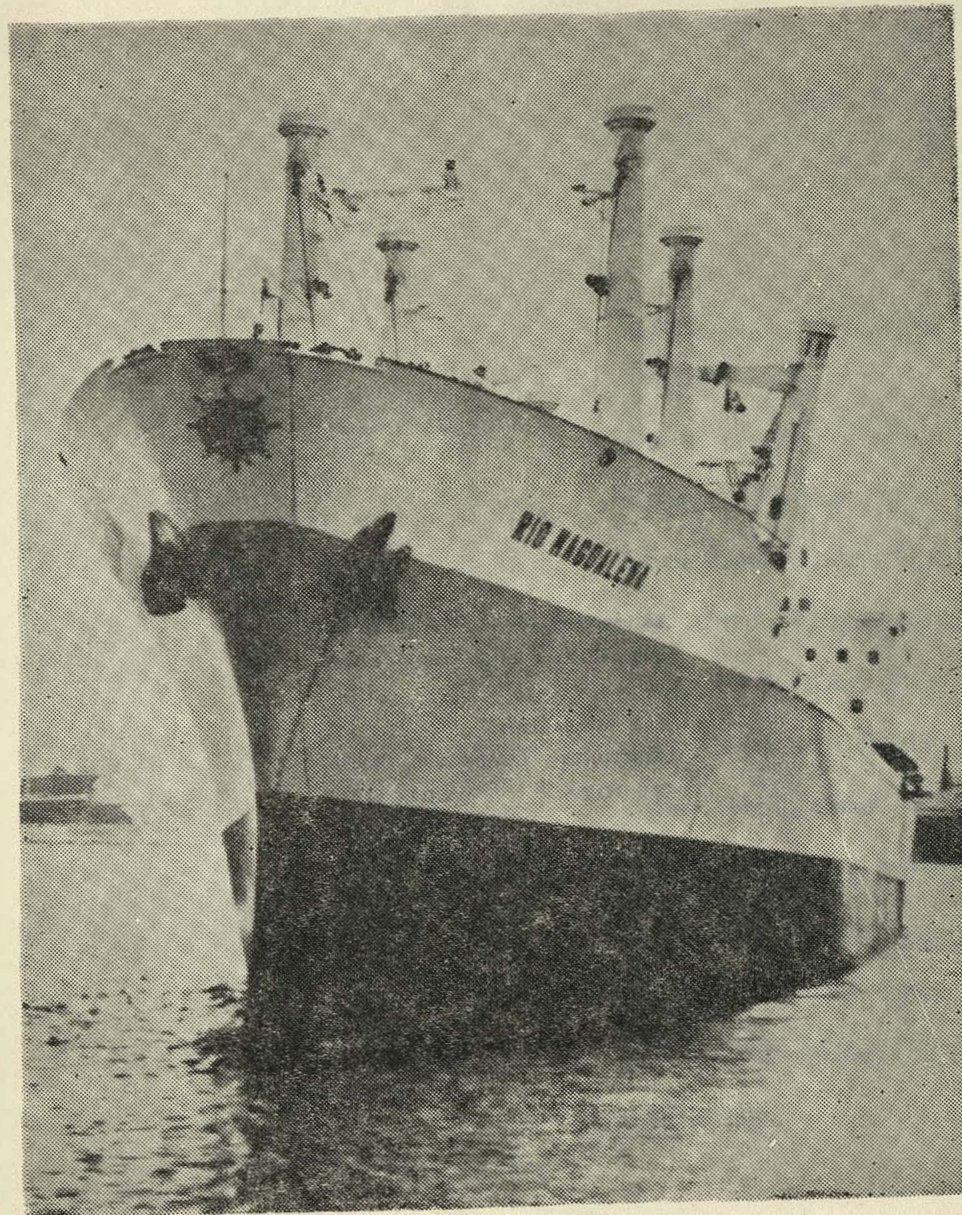
BUQUE "RIO MAGDALENA"

Al Servicio de la Producción Nacional 155 oficinas en el País.