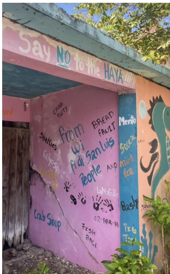
Imagen 4 (foto tomada 28/07/2022) donde los raizales a partir de este grafiti rechazan el Fallo de la Haya (casa ubicada en el sur de la isla, donde resalta Say No the haya, di no a la haya)

Todo ha sido un proceso donde Nicaragua hasta el 2022 ha denunciado a Colombia por violar ciertos límites fronterizos donde afirma que no han respetado límites, la mayoría de los colombianos pisan aguas nicaragüenses y han violado otras cosas que no puede hacer dentro del territorio que ahora les pertenece. Aun así, a Nicaragua no solo le basto el haberles cedido el meridiano 82, sino también sigue reclamando su poder sobre las islas y sus cayos.