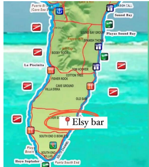
Imagen 2: Elsy bar, barrio donde vive Sheyla y salen a pescar la mayoría de las mujeres pescadoras.

Sheyla me empieza a narrar que ella y sus demás amigas pescadoras salen a pescar desde Elsy bar, un lugar ubicado al sur de la isla (imagen 2) cercano a sus viviendas. Debido a las múltiples cargas productivas y reproductivas, sus días transitan entre la visita por diferentes sitios de San Andrés. El cumplir con sus compromisos “naturalmente asignados”, les obliga a moverse todo el tiempo. A veces vienen al norte de la isla, donde se encuentra ubicada la cooperativa para comprar-vender algunos peces a los pescadores; otras veces se mueven por Elsy bar desde donde salen a pescar; y, otras más, transitan entre Coopesbi y sus casas, ya que casi todas las pescadoras cumplen la función de amas de casa.