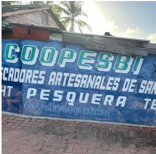
Imagen 5. Cooperativa de pescadores en North End (foto tomada el 25/07/2022)