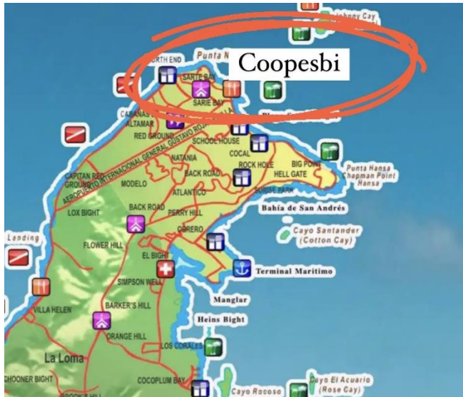
Imagen 1. Ubicación de Coopesbi al norte de la isla.