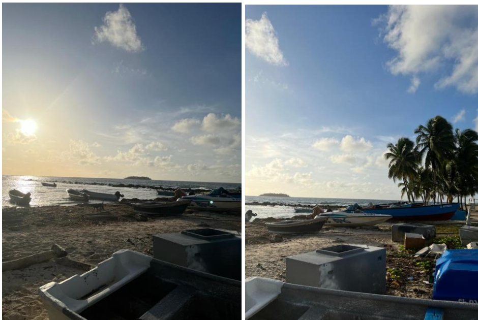
Imagen 11: Lanch, embarcaciones en las que van a pescar los pescadores y pescadoras en el Archipiélago (foto tomada el 15/07/2022)