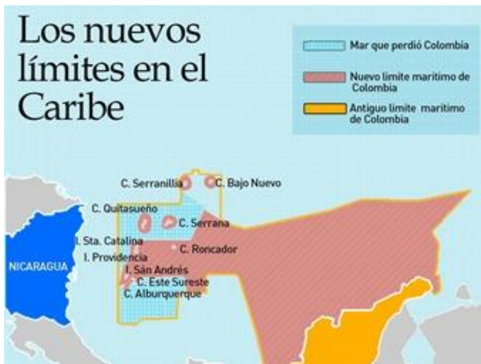
Imagen 8 (Mapa en el que se puede observar mar que perdieron los raizales)

deben pisar aguas nicaragüenses. Además, los pescadores y las pescadoras afirman que la nueva delimitación ha generado respuestas de temor y miedo en el momento de viajar a esos cayos a pescar. Antes del Fallo de la Haya podían transitar de manera “tranquila” por las aguas. Tranquila en términos de estar en territorio nacional y solo debían preocuparse por los avatares propios del oficio. Después del fallo y en la actualidad, el pescar en esta zona se ha convertido en una odisea. La mayor parte de las mujeres entrevistadas han vivido o han escuchado situaciones en que sus barcos son atacados por embarcaciones nicaragüenses, y son hostigados por estas personas. Mencionan que en ocasiones pueden llegar a cogerlos ilegalmente por el simple hecho de pisar agua nicaragüense. Vale la pena decir que estos límites son fronteras en papel. En la práctica no hay ninguna malla, ni mucho menos una línea o señalización alguna que defina los límites fronterizos.