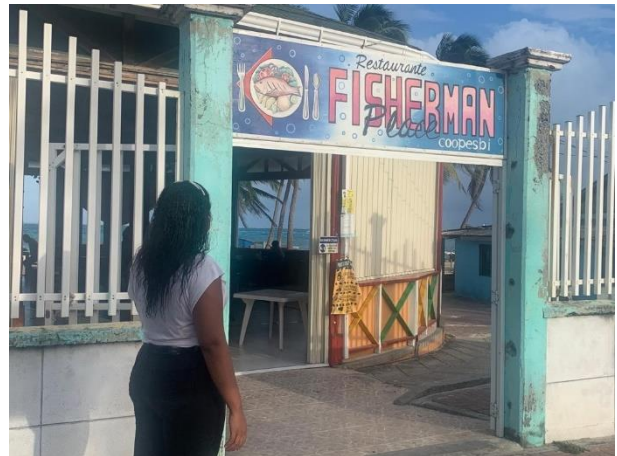
Imagen 6. Restaurante de la cooperativa de pescadores al Norte de la Isla (foto tomada 3/12/2021)

De lo anterior, se puede observar claramente la desigualdad de género donde esta “se expresan tanto en la asignación de identidades y actividades, como en la separación de los ámbitos de acción a los que corresponde una designación diferente de valor simbólico, donde lo masculino cobra preeminencia sobre lo femenino. De esta valoración superior de la dimensión masculina se deriva un acceso desigual al poder y a los recursos, que determina jerarquías en las relaciones sociales entre hombres y mujeres” (Valenzuela, 2003, pág.18)