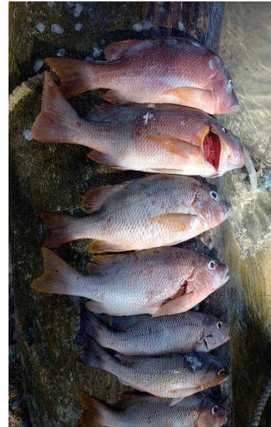
Fotos 1 a 6. Pescados y langosta capturados por pescadoras (11/06/2022)