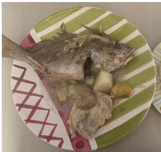
Imagen 9 (foto tomada 14/07/2022) bailop, plato típico de la gastronomía raizal

renunciar a una vida personal, e incluso a ser madres, por anteponer la profesión. En este sentido, queda mucho camino por recorrer para alcanzar la igualdad de género en la pesca profesional” (Entrevista a María del Carmen Argudo) (Ministerio de agricultura y pesca, 2022, pág. 37)