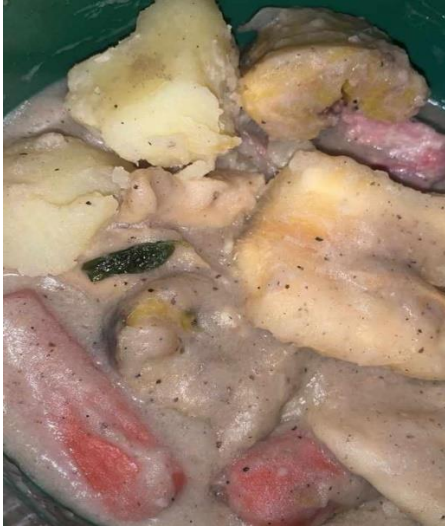
Foto 10 rondón, platos típico de la isla hecho por mi mamá con pescado y caracol que nos regaló una pescadora