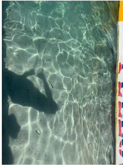
Silueta de pescador (foto tomada el 15/12/2021)