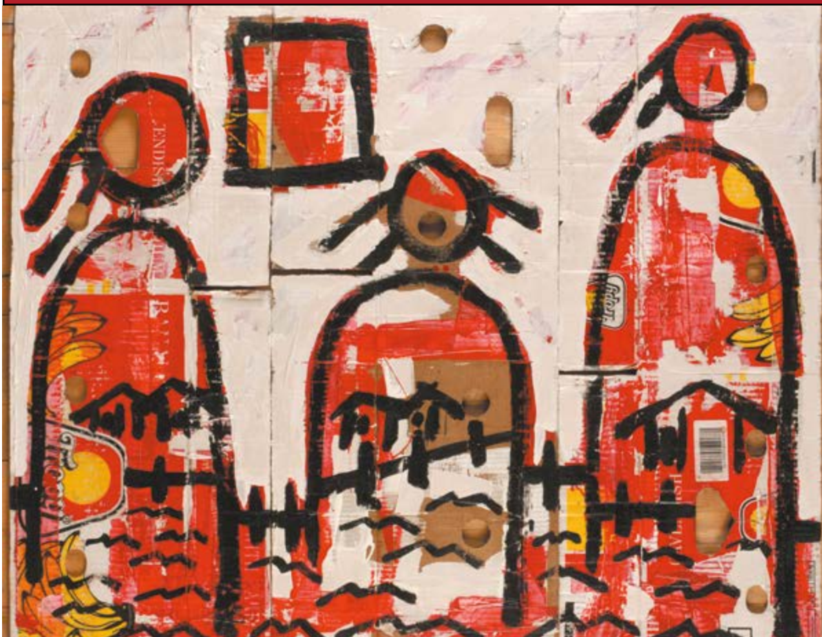
← Los niños que fueron reclutados por los grupos subversivos hoy pueden estar alrededor de los 15 años o muy cerca a cumplir la mayoría de edad.

bién ratificó la Convención sobre los Derechos de los Niños por medio de la Ley 12 de 1991, dos años después de su adopción por parte de la Asamblea General de las Naciones Unidas.