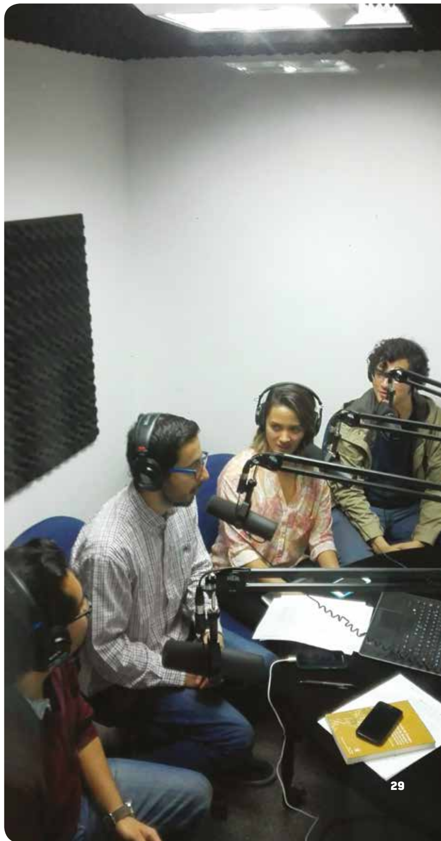
Programa dedicado al libro Del este de Europa al sur de América .

Y mientras el director de Le Monde Diplomatique insistía en “Internet, el mundo que viene”, en un cambio en el orden global producido por la aceleración de la información, Gabriel Zaid en 1972 nos alertaba sobre “Los demasiados libros”. Esa delgada línea entre la información y el análisis, entre el exceso y la velocidad, entre la crítica y la opinión, me obliga a preguntarme: ¿cómo se incrusta un programa sobre libros en la parrilla de la nueva emisora universitaria? Frente a la gran cantidad de información, ¿cómo