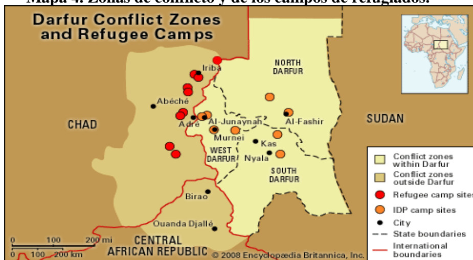
Mapa 4. Zonas de conflicto y de los campos de refugiados.