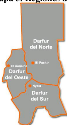
Mapa 3. Regiones de Darfur