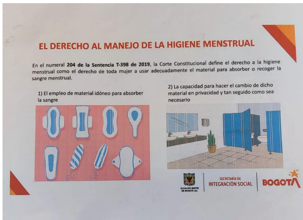
Foto propia de la cartilla presentada por la tallerista