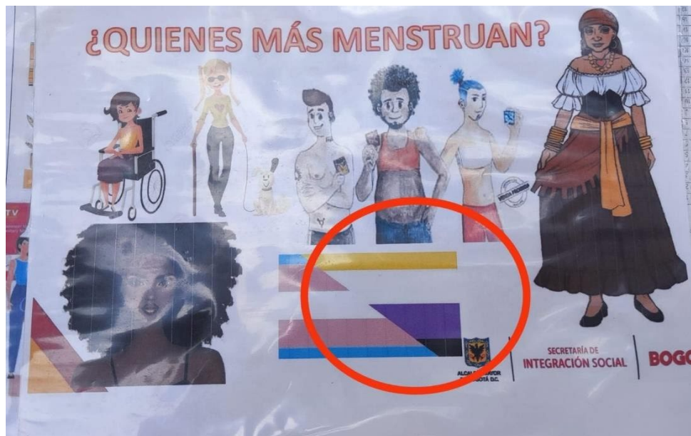
Foto propia de la cartilla presentada por el tallerista. Los círculos en color rojo añadidos demarcan la bandera de las personas no binarias

El problema aquí es que la menstruación no tiene nada que ver con el género masculino, femenino o, en este caso, no binario. La menstruación está dada por los sistemas reproductores de las personas, más no con el género con el que se identifican. Esto, más que nada, da cuenta de una profunda confusión entre sexo y género.