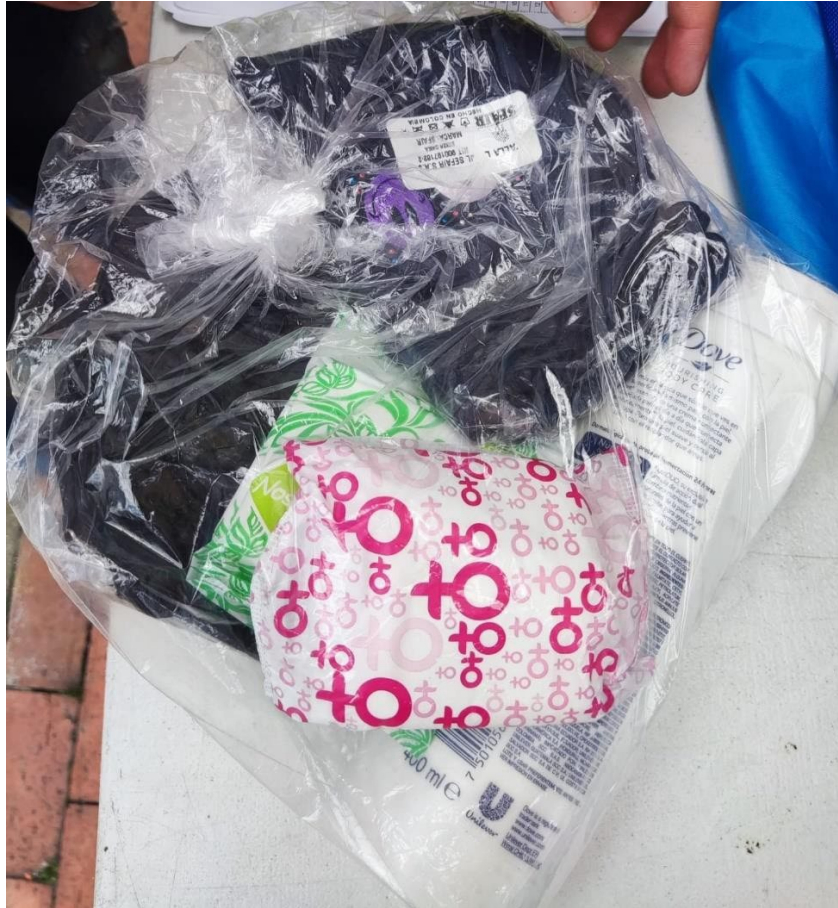
Foto propia del kit de salud menstrual en una de las Jornadas.

Aun así, este kit no es realmente útil en términos de higiene menstrual más allá de las toallas higiénicas. La ropa interior, por su parte, tiene tallas poco realistas cuando se piensa que está dirigida a mujeres habitantes de calle, quienes suelen tener poca masa corporal y suelen tener tallas pequeñas. En este sentido, de las catorce mujeres que abordé, solo una de ellas tenía la talla apropiada para usar un brasier talla 38 y unos calzones talla L. Las otras mujeres eran considerablemente pequeñas y sus tallas no eran mayores a la S. En últimas, estos insumos no se ajustan a las verdaderas necesidades de las mujeres y, antes bien, vulneran sus derechos al manejo de la gestión menstrual.