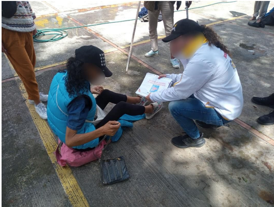
Foto propia tomada durante una Jornada de autocuidado

Del dicho al hecho hay mucho trecho: de la Corte Constitucional a la Secretaría Distrital de Integración Social