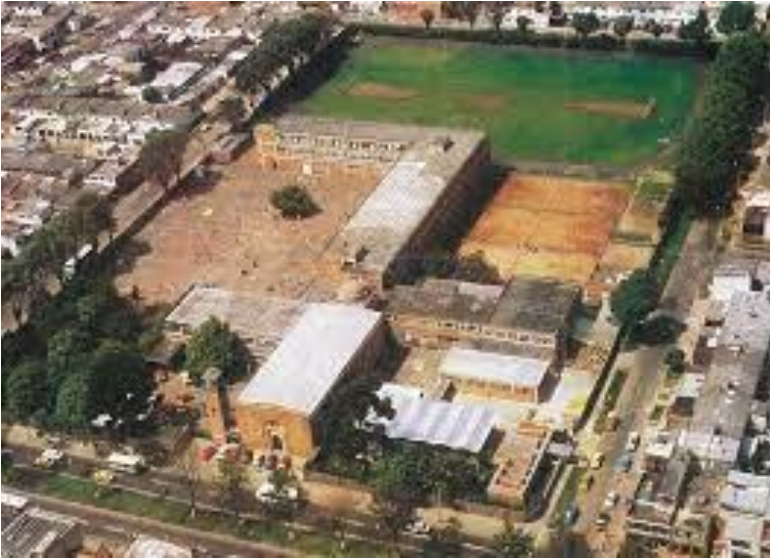
Figura No. 4 Quinta Mutis. circa 1980. En la foto se visualizan las áreas construidas y amplios espacios para actividad deportiva, en particular el campo de fútbol y tres canchas de tenis.