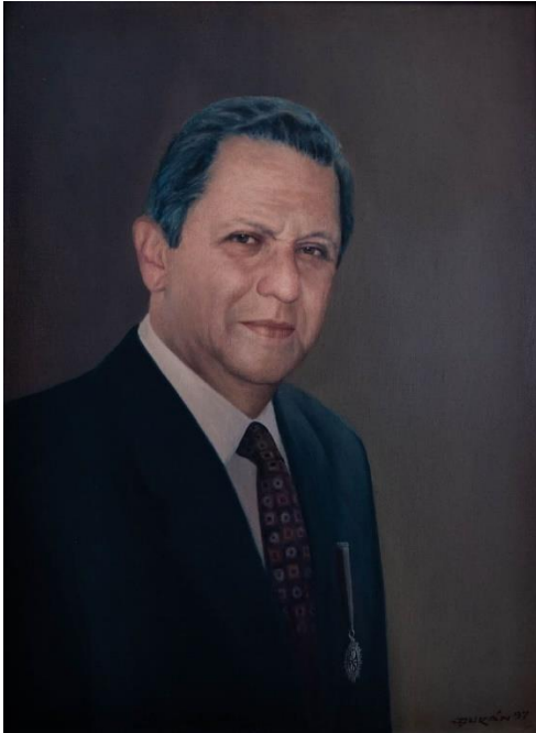
Mario Suárez Melo. Autor: Justiniano Durán. Óleo sobre lienzo.