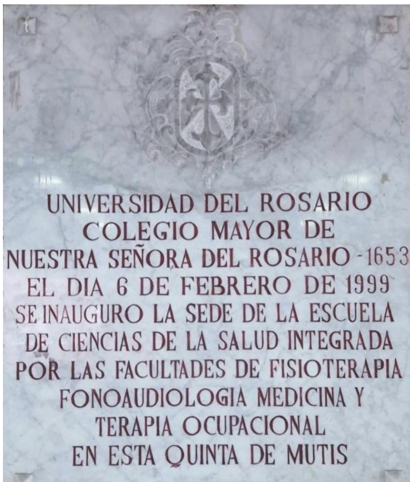
Figura No. 5. Placa conmemorativa de la inauguración de la escuela de ciencias de la salud de la Universidad del Rosario.

Adicionalmente, se iniciaron algunas prácticas de alumnos de las tres facultades de Rehabilitación (Fisioterapia, Fonoaudiología y Terapia Ocupacional) y de estudiantes del programa de especialización en epidemiología, el cual se adelantaba en conjunto con el Centro de Estudios de la Salud (CES), hoy Universidad CES, de Medellín. (4)