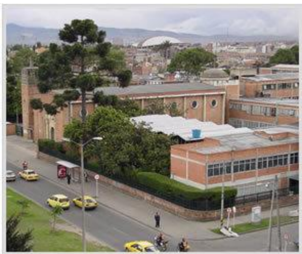
Figura No. 4. Quinta Mutis.

La sede, adquirida por la Universidad en 1923, tenía en ese entonces 17.000 metros cuadrados, amplios espacios para aulas, laboratorios, auditorio, biblioteca y oficinas, con amplias y hermosas áreas de bienestar, jardines, con enormes árboles de magnolios, 3 canchas de tenis y un campo de fútbol de dimensiones profesionales. (6) Figura No. 4 Quinta Mutis.