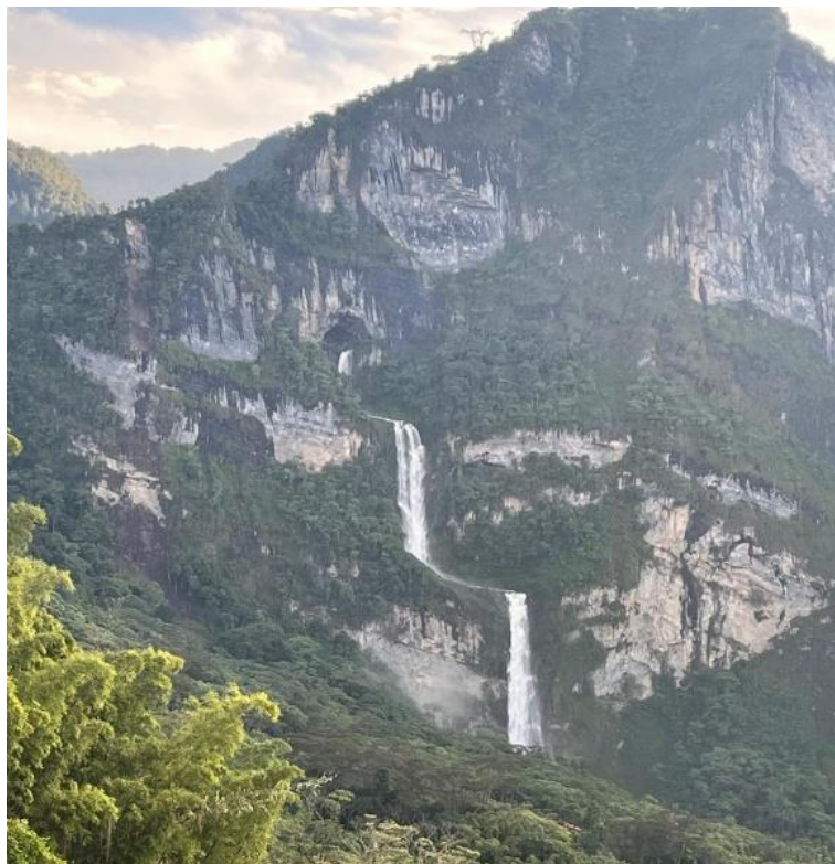
Foto de las Cascada de las Ventanas de Tisquizoque.