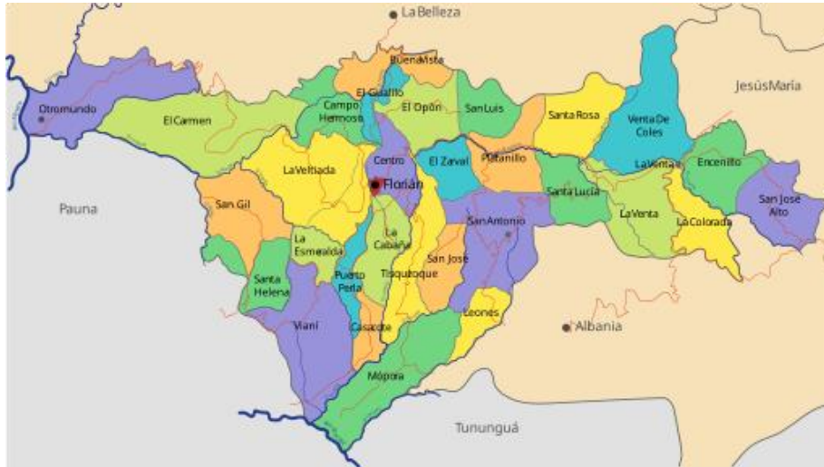
[mapa 3]