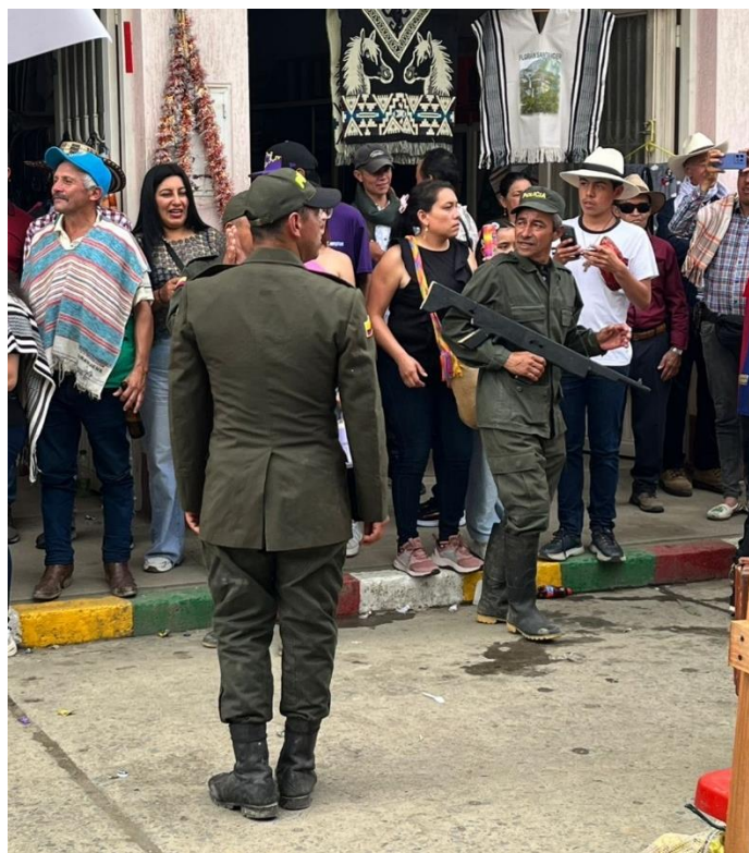
Campesinos disfrazados de policías para las “ferias del campesino 2024”. Florián, Santander, 2024.