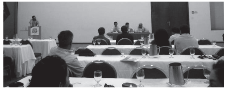
XXVII Congreso Anual de Abogados, organizado por el Colegio de Abogados Rosaristas.