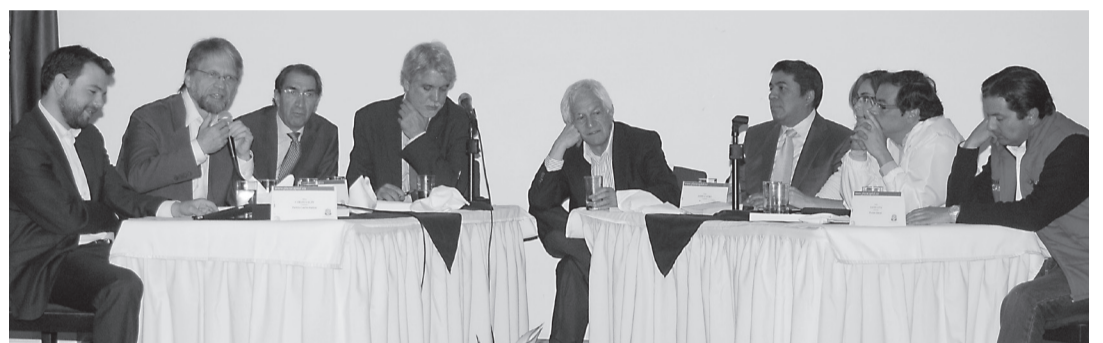
Debate con los candidatos a la Alcaldía de Bogotá, organizado por el Programa de Periodismo y Opinión Pública.