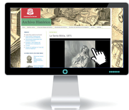
El blog del Archivo Histórico llegó a más de 17 mil visitas.

The Historic Archive's blog of Universidad del Rosario had more than 17 thousand visits; this place has been of the interest of national and international researchers who want to know more about the documents kept in this Archive.