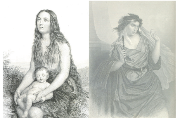
"La santa biblia" de Don Felipe Scío San Miguel, es de gran importancia histórica por sus ilustraciones de las mujeres bíblicas, hechas por Gustave Staal.