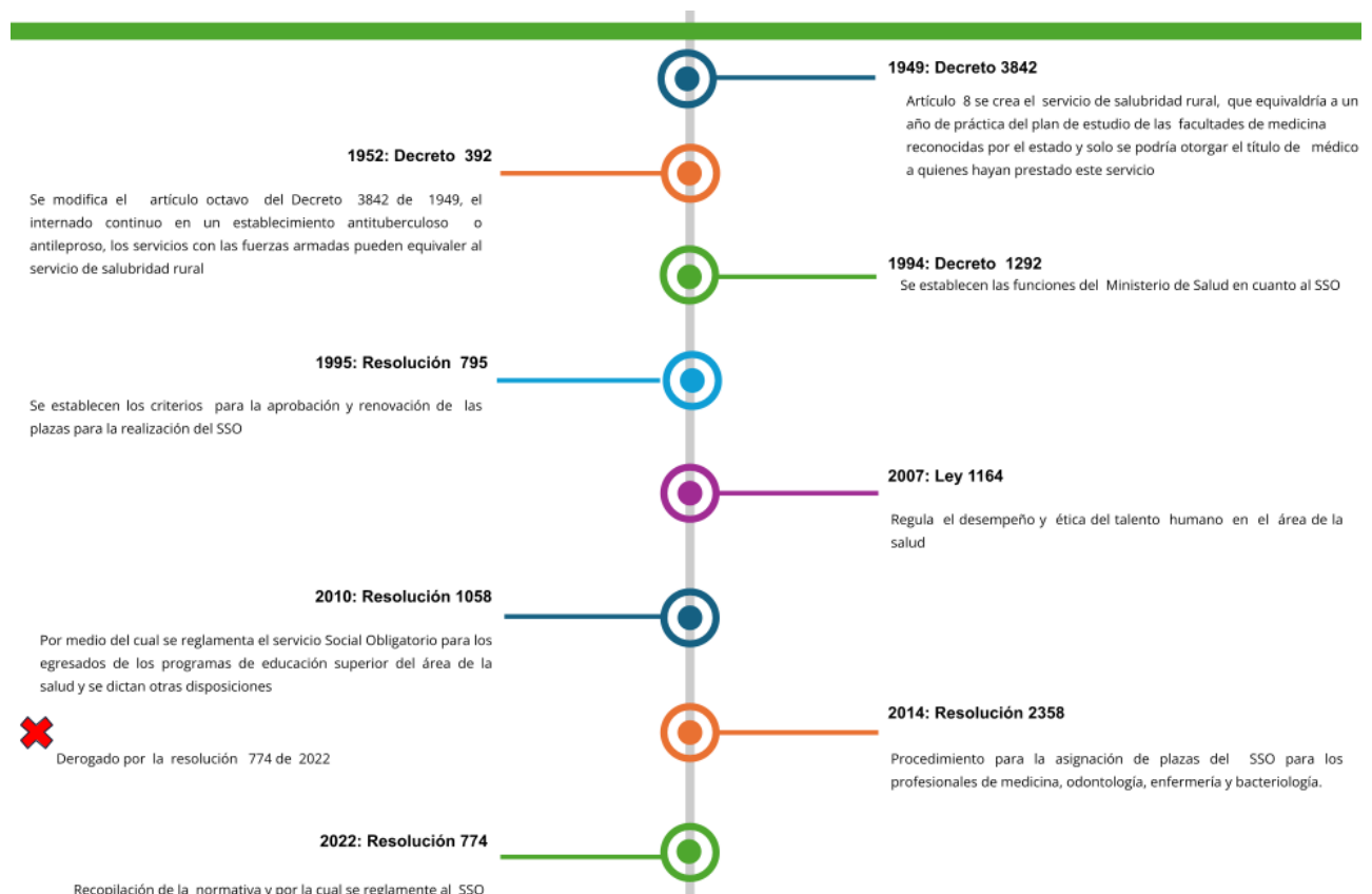
Ilustración 1. Línea del tiempo normativa SSO.

Fuente: Elaboración propia y datos tomados de (Congreso de Colombia, 2007; Ministerio de la Protección Social, 2010; Ministerio de Salud, 1995; Ministerio de Salud y