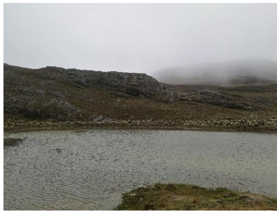
Imagen de la laguna que construyeron los campesinos para represar el agua