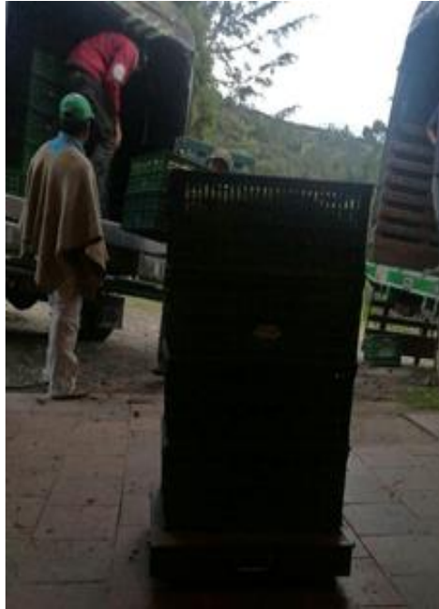
Imagen donde se ven los hombres en el proceso de pesaje de la uchuva

La anterior respuesta por parte de Doña Gloria también demuestra que aunque el proyecto de la uchuva se planteó como un proyecto exclusivo de mujeres, ellas también reconocen que necesitan apoyarse en los hombres en tareas específicas como el cargue de los camiones. Empero, es claro que la posición y el papel que juega la mujer en el Cerrito ha cambiado a partir de los proyectos productivos, pues estos le garantizaron una autonomía política y económica que les quitan la posición de subordinación que muchas veces tienen con los hombres. Como lo menciona Escobar (1998) este tipo de discusiones también demuestra que las luchas de géneros siguen inmersas en las discusiones de la ruralidad colombiana, pues estas son en gran parte las que dirigen los procesos de construcción y configuración territorial que se dan en los territorios.