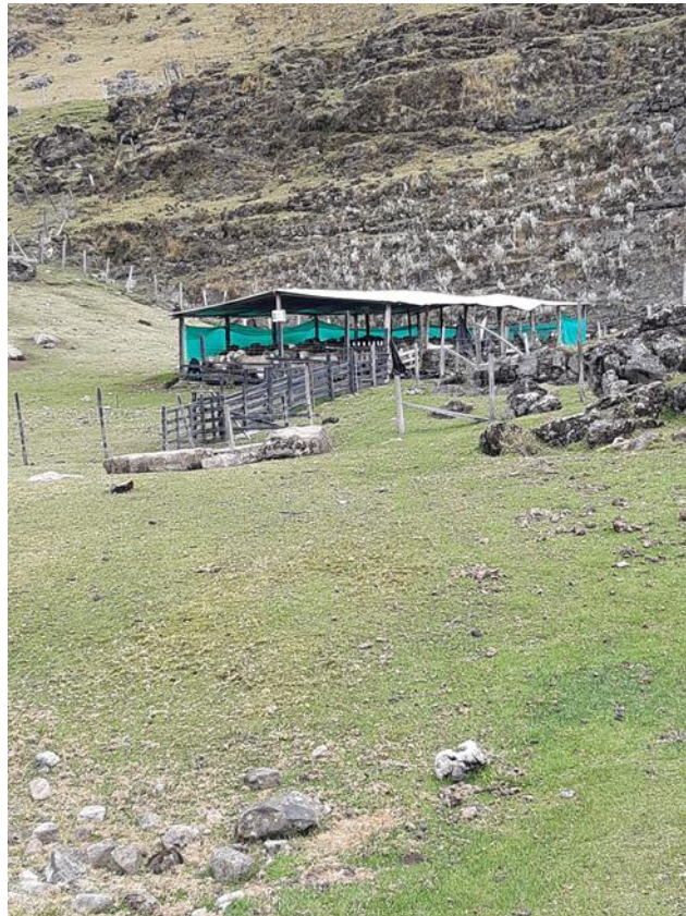
Imagen de los corrales que construyeron para la protección de las ovejas

El proyecto, en un comienzo se planteó en tres fases: la primera fue la construcción de apriscos, donde guardaban las ovejas en la noche o cuando estaban a punto de dar a luz. La segunda fue la construcción de corrales y cámaras de trampeo, la construcción de los corrales se dio más con la idea de que las ovejas no estuvieran todas regadas en la finca durante el día. Y la tercera fase que es la más importante y en la que se está trabajando en este momento es la zonificación y la muestra de cada una de las fincas que hacen parte del proyecto. Con la primera y segunda fase se empezó a poner en práctica la protección del cóndor, pues los corrales empezaron a ser un medio para que los cóndores no se pudieran comer las ovejas. Con lo anterior, garantizan la protección de las ovejas y del cóndor pues ya los campesinos no los matan.