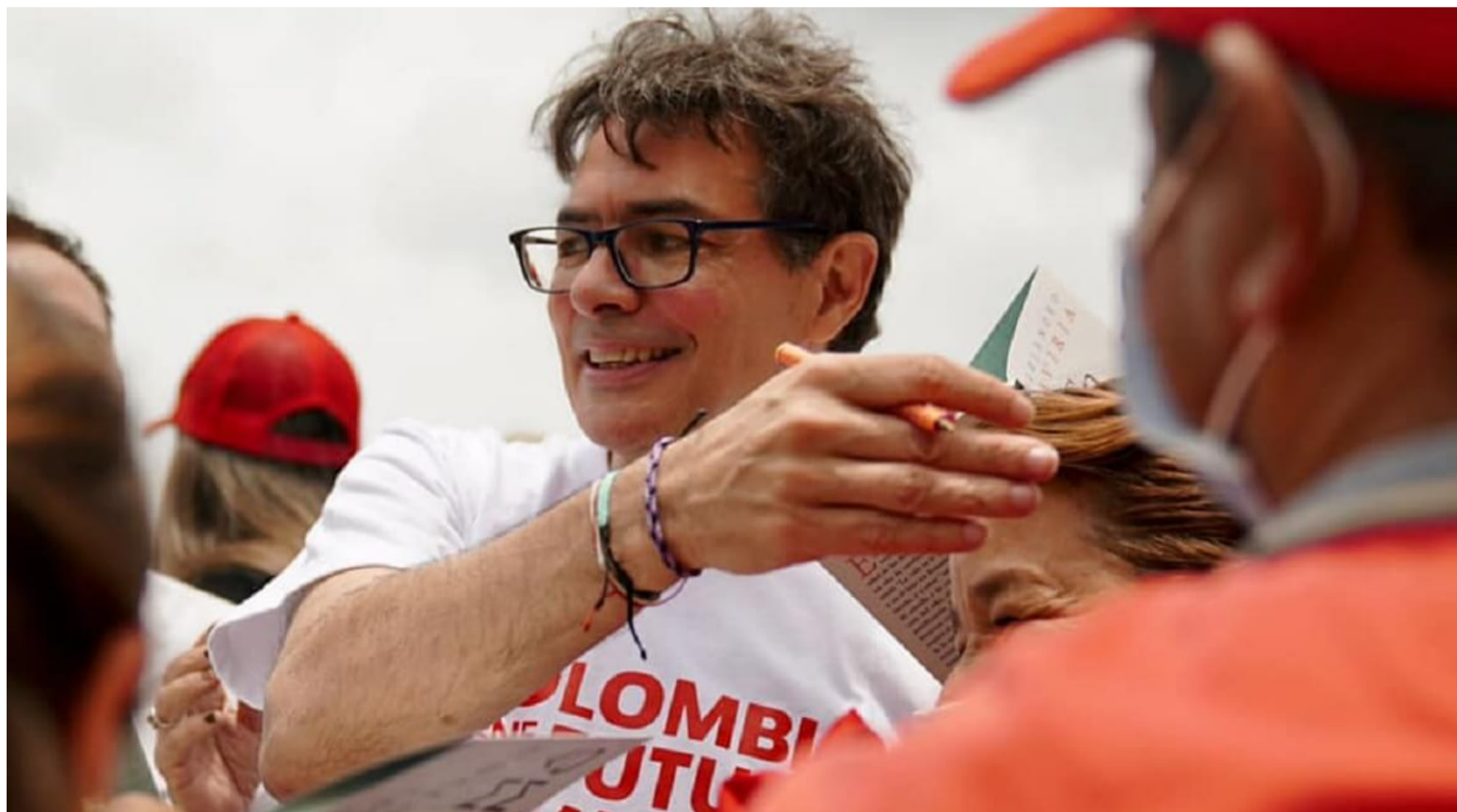
El rechazo de Alejandro Gaviria de presentarse a la elección con las banderas del Partido Liberal ha generado fuertes críticas hacia el director del Partido.

Antes de saber quiénes se enfrentarán en la competencia por la Presidencia de la República, hay que superar la prueba en las elecciones para Congreso. Allí los distintos grupos se enfrentan y cuentan sus fuerzas, motivo por el cual todo es incierto.