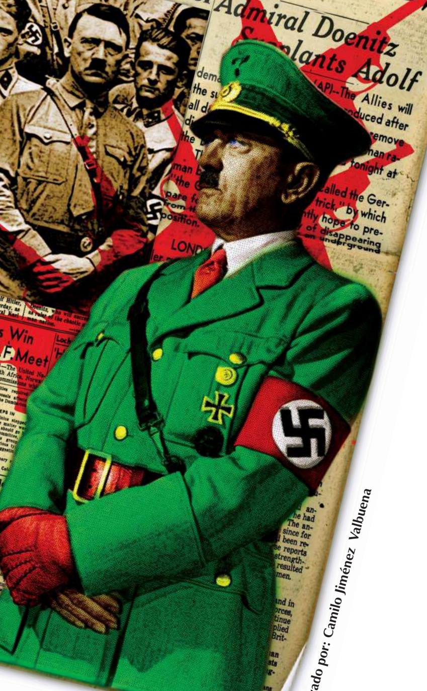
Ilustrado por: Camilo Jiménez Valbuena