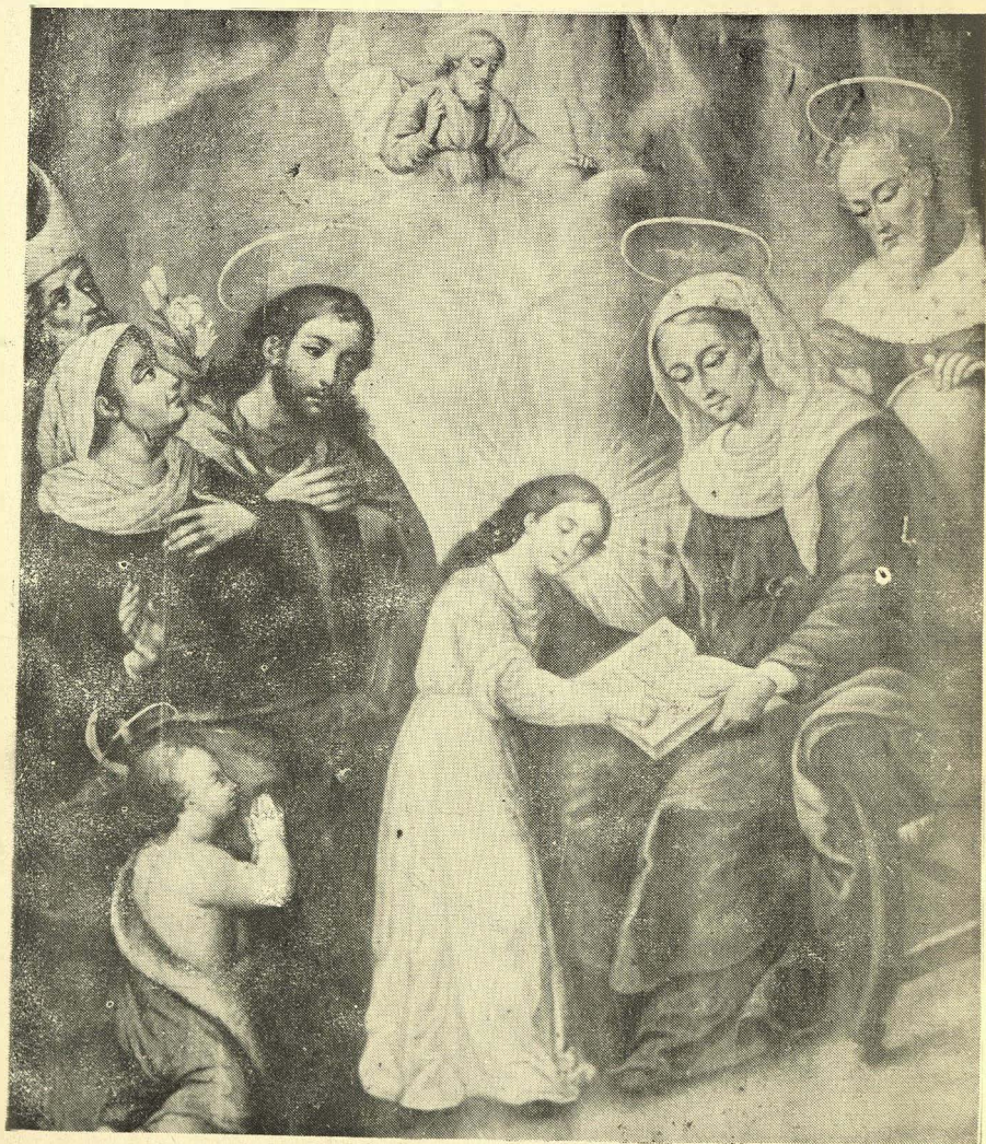
La Virgen María, San Joaquín y Santa Ana