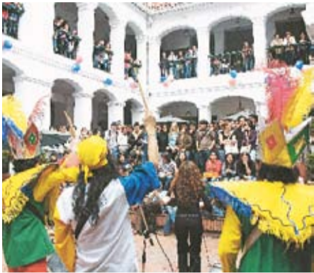
La comunidad rosarista en general participó de esta actividad, escuchando y bailando la música brasilera ♦

Año 8 • No. 13 • Septiembre 10 - Septiembre 24 de 2007 • Bogotá D. C., Colombia • ISSN 1692 - 5866