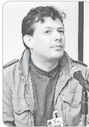
El periodista Hollman Morris compartió sus experiencias con los alumnos del Rosario ◆

Por otra parte, rescata el papel de medios como Semana y El Espectador porque han luchado por sacar adelante la verdad para el país. Los medios han dado prioridad al periodismo como negocio y no la calidad informativa. De ahí que escaseen géneros periodísticos como el reportaje en los que se analice y explique lo que está pasando.