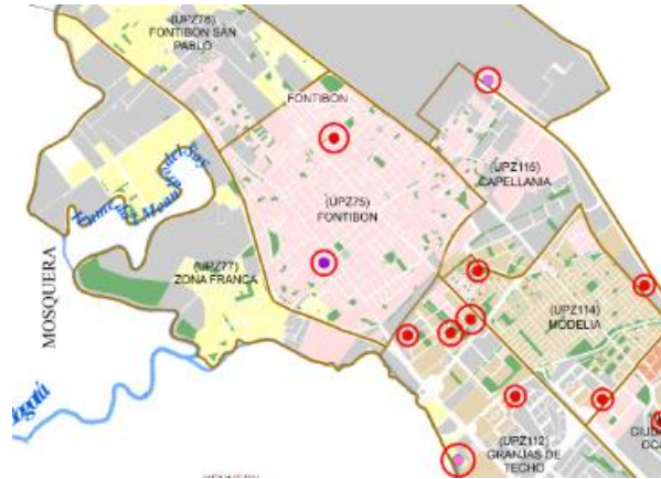
Imagen 1: Localidad de Fontibón y Área Zona Franca (Alcaldía de Bogotá, 2020)

esto contiene un factor nocivo porque el individuo no es consciente de su actuar hasta que la situación de sale de control y es la razón por la que se golpea al menor.