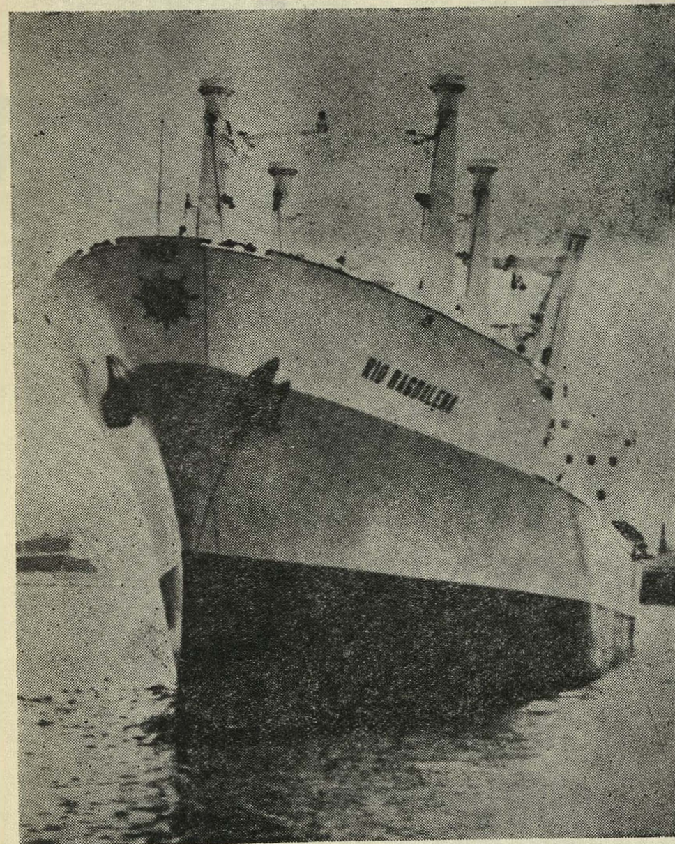
BUQUE "RIO MAGDALENA"

Nueva unidad de nuestra Flota Mercante Grancolombiana, recientemente inaugurada en el terminal de Barranquilla, como homenaje a la arteria vital del país.