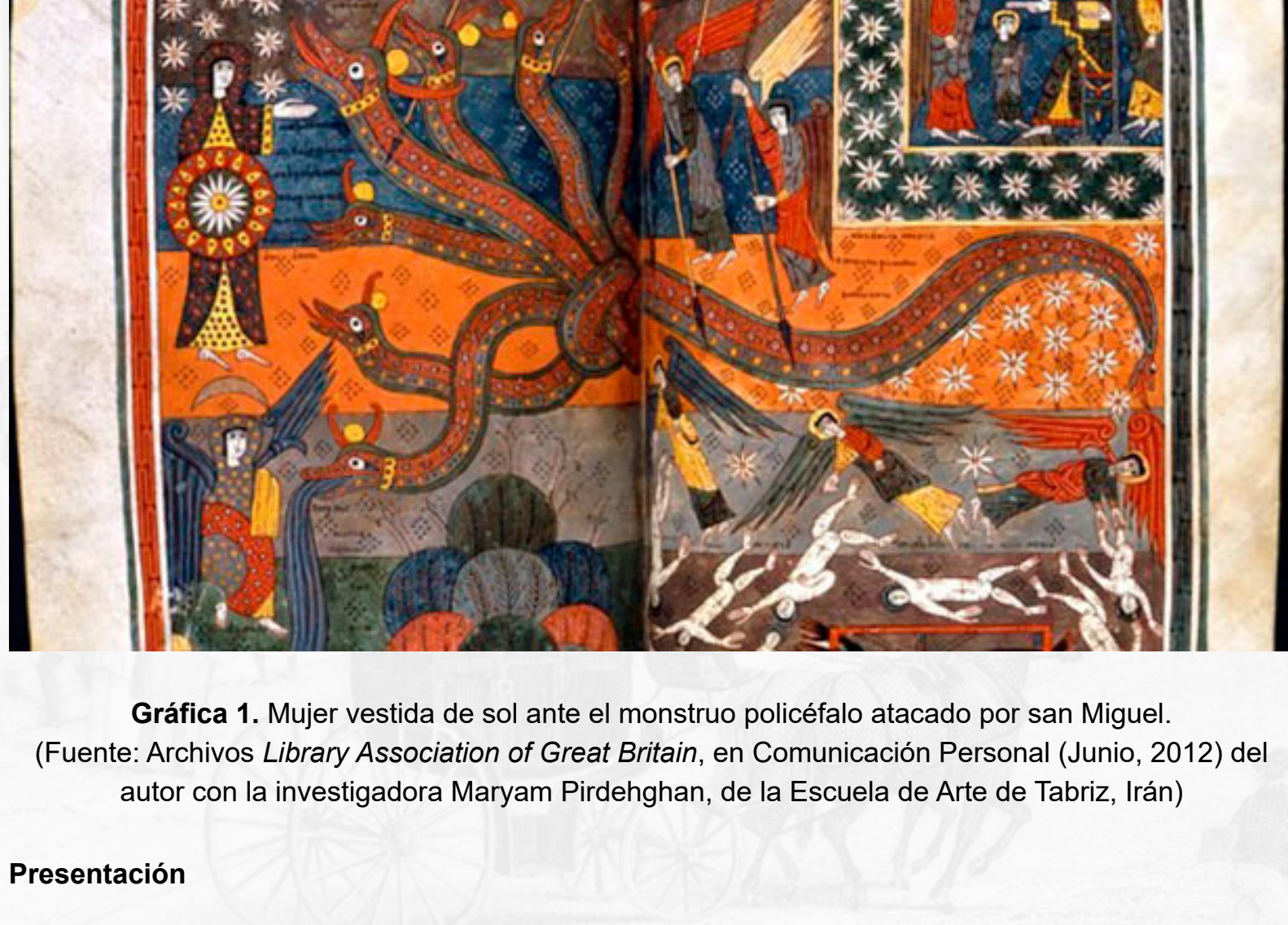
Gráfica 1. Mujer vestida de sol ante el monstruo policéfalo atacado por san Miguel.