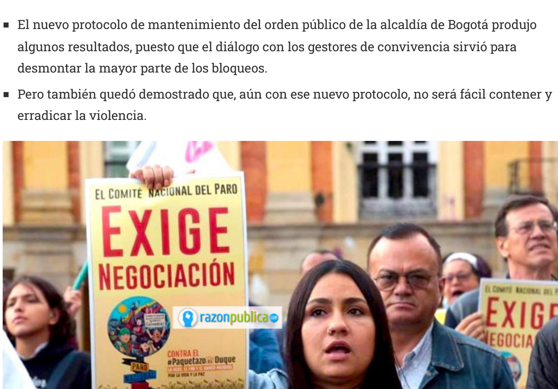
Con el paso de los días se han ido diluyendo las demandas del paro.

Ciertamente, es un logro significativo que, el 21 de enero, la policía hubiera actuado con más cabeza fría y haya recurrido a la fuerza como un último recurso y de forma mucho más proporcionada. De ese modo, la policía ajusta su manera de intervenir en las protestas a los estándares del derecho internacional, y sobre todo reestablece mejor el orden público. Cuando la fuerza policial de un Estado no es ella misma capaz de actuar prudente y retenidamente, aumenta la probabilidad de un desborde violento.