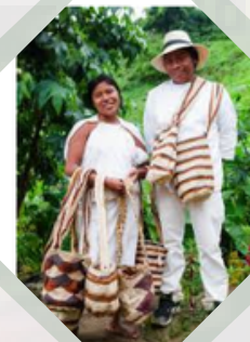
COMUNIDADES QUE PROSPERAN