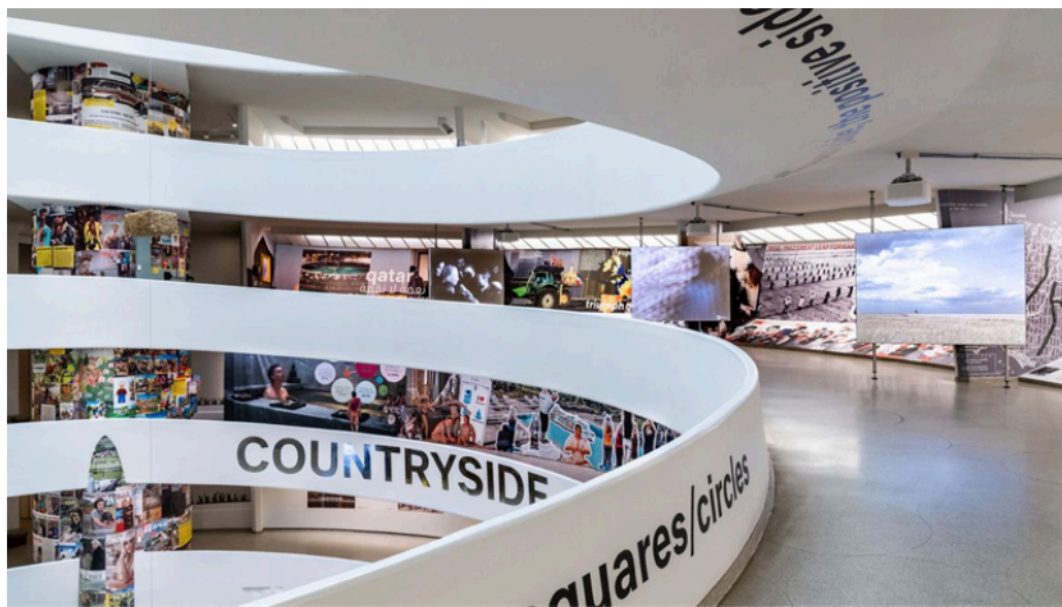
Figura 3. Vista de la instalación en el museo Guggenheim