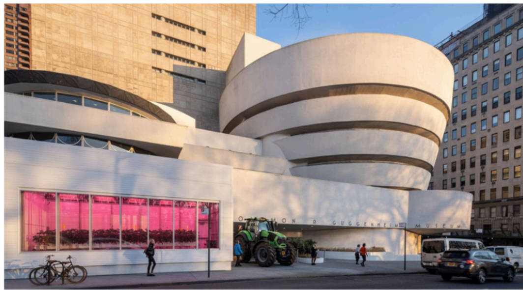
Figura 4. Vista de la instalación en el museo Guggenheim, febrero-agosto 2020