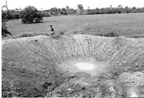
Operación Génesis en Riosucio, Chocó