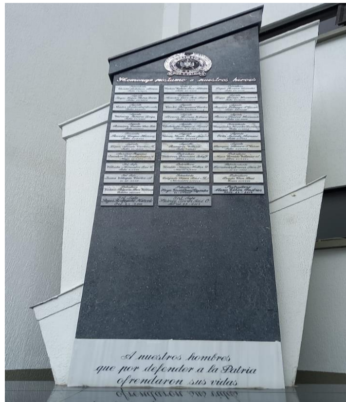
Gomez J, (2023) Fotografía tomada del monumento homenaje postumo a nuestros heroes, Manizales Caldas.