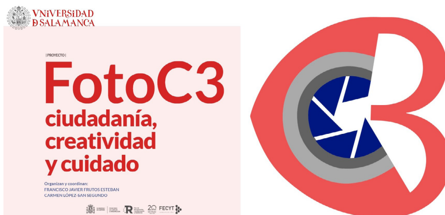
Figura 3. Página de inicio de FotoC3 ( https://fotoc3.usal.es )