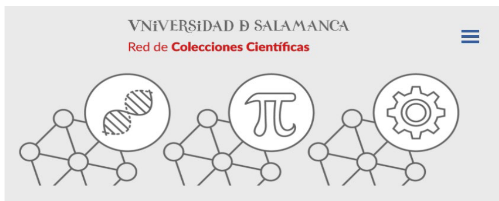
Figura 1. Página de inicio de la Red de Colecciones Científicas de la Universidad de Salamanca, ( https://coleccionescientificas.usal.es )