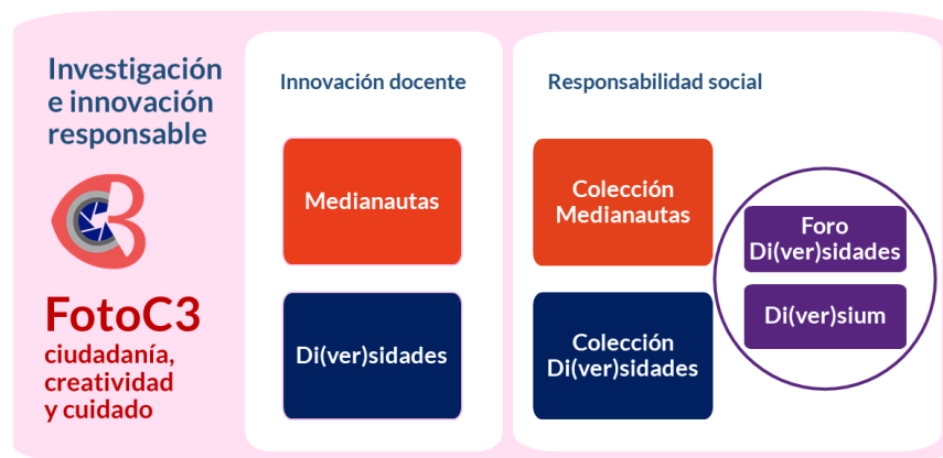
Figura 2. Mapa conceptual de FotoC3

Bajo este enfoque renovado y en dicho contexto se está desarrollando la experiencia de investigación e innovación responsable FotoC3: ciudadanía, creatividad y cuidado (Figura 2), una iniciativa que promueve la coeducación en el contexto de la enseñanza superior mediante el uso sistemático de la fotografía colaborativa, la innovación docente, la indagación autoetnográfica, la creación cultural y la educación patrimonial. FotoC3 se articula en torno a dos acciones — Medianautas y Di(ver)sidades — cuyo resultado son dos colecciones universitarias de etnofotografía de carácter institucional, de acceso público y de gestión colaborativa: la Colección Medianautas y la Colección Di(ver)sidades . Esta acción emerge a partir de una doble reflexión que facilita el proceso de creación fotográfica desarrollado en las dos acciones que lo conforman, FotoC3 (Figura 3) afronta el reto de promover la coeducación abordando el debate contemporáneo sobre la identidad de género y la diversidad afectivo-sexual, para así fomentar un proceso intencionado y consciente de intervención coeducativa en favor del desarrollo integral de las personas independientemente del género al que pertenezcan y que, por tanto, evita coartar capacidades en base al asignado.