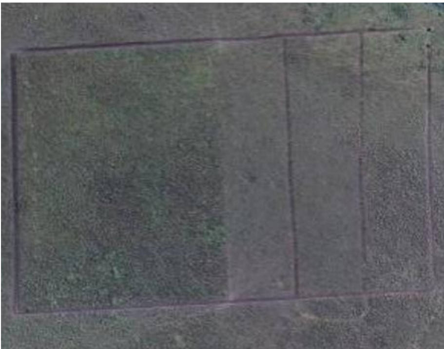
Figura S3. Imagen satelital del diseño experimental evidenciando diferencias entre parcelas