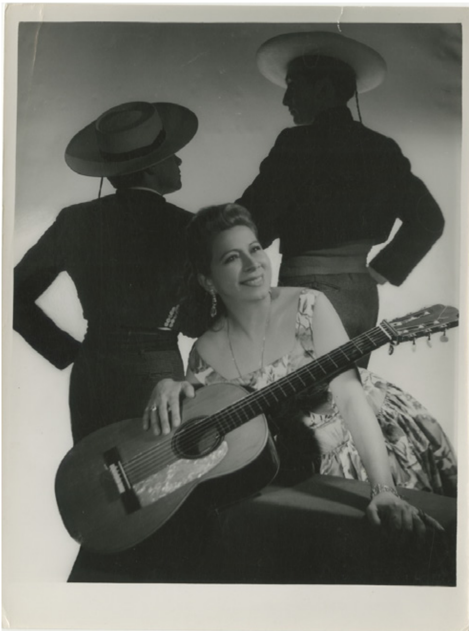
Alfredo Molina La Hitte. Mujer junto a huasos. Fondo Alfredo Molina La Hitte, Cultura Digital udp. Nota. Recuperado de: https://bit.ly/3RFnB7i

Una mujer posa altivamente en traje de baño, reclinada sobre una esterilla de paja, mientras la luz que emerge de su espalda acentúa la transparencia de un velo que rodea su brazo. En otras imágenes, realizadas en estudio, Alfredo Molina La Hitte crea retratos grupales en los que se incorporan vestimentas, instrumentos y ornamentos vinculados al universo folclórico del país. Nítidamente registrados en composiciones equilibradas con juegos de sombras, los personajes no miran directamente a la cámara. El fotógrafo evoca esa realidad popular para traducirla al refinado lenguaje de una puesta en escena más elevada. Estos artificios de Molina La Hitte fueron aplicados a sus retratos de la clase alta, la clase media emergente y también a los artistas de espectáculos musicales ligados al entretenimiento nocturno. Después de haber trabajado como diseñador de decorados para teatro y estudiar bellas artes, se dedicó a retratar los eventos sociales de la revista Zig Zag, producto editorial ampliamente distribuido entre 1905 y 1964 en Chile.