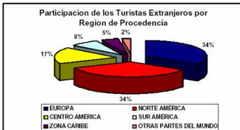
Tabla N. 2