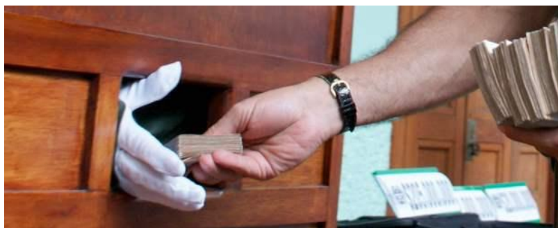
“Foto cortesía policía metropolitana fragmento de texto, cortesía de un informante | En el cubículo se introduce a la persona que reclamará la recompensa. El comandante de la Policía, en el otro lado, es el encargado de pagarle a quienes se atrevieron”. Tomado de: http://www.elcolombiano.com/BancoConocimiento/T/todo_tiene_un_precio_para_los_informantes/todo_tiene_un_precio_para_los_informantes.asp

El pago a los informantes constituía un ritual. Según la prensa, a diferencia de los experimentados, a quienes no les interesaba la clandestinidad, los colaboradores novatos preferían usar todos los artilugios disponibles para ocultar su identidad. Por esta razón, se adaptaron espacios con forma de confesionarios para que los colaboradores pudieran recibir el dinero sin ser vistos. En este sentido, El Colombiano señala: “Prefieren el cubículo de madera con pinta de confesionario y guantes blancos para que no les reconozcan ni las uñas” 219 , como lo demostraban con la siguiente foto: