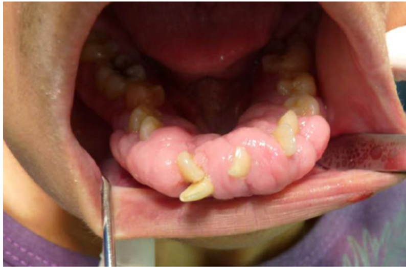
Figura 3. Aumento en el volumen de la encía en el sector anteroinferior