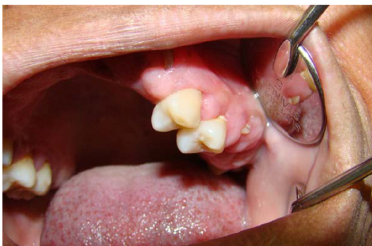
Figura 2. Aumento en el tamaño en el tejido gingival

En la inspección intrabucal, la madre presentó aumento en el tamaño del tejido gingival de la zona posterosuperior e inferior, lo que afectaba la encía papilar, marginal y adherida, de color rosa pálido, superficie lisa, cubriendo un tercio de la corona dental, de consistencia firme, asintomática a la palpación, ausencia de sangrado y de once meses de evolución, se observó biofilm supragingival en los molares del maxilar (figura 2), radiográficamente se observó destrucción coronal completa y ensanchamiento del ligamento periodontal de los dientes 12, 23, 26 y 27, desplazamiento dental de los dientes 31, 32, 41 y 42.