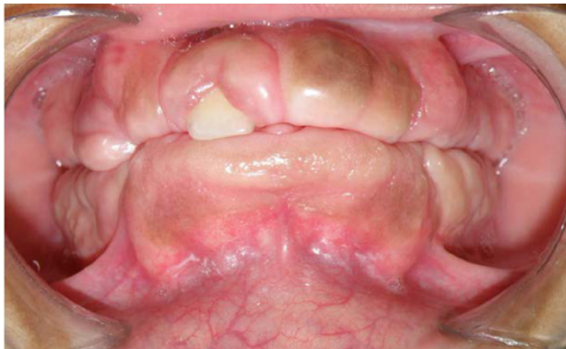
Figura 4. Agrandamiento gingival generalizado

En la paciente femenina de la primera generación, se observó agrandamiento gingival generalizado que cubría el 80 % de la corona dental, de superficie irregular, del mismo color de la mucosa adyacente de consistencia firme, apariencia fibromatosa, no sangrante, de aproximadamente un año de evolución, asintomático, le originaba discapacidad funcional y estética, se observó biofilm supragingival en los molares del maxilar y mandíbula (figura 4). En la radiografía panorámica se observaron dientes en buen estado general y la presencia del diente número 73.