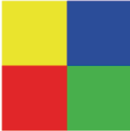
Figura 1. Ejemplo de experiencia elemental momentánea.

La Figura 2 ilustra el concepto de espectro de sensaciones. Imaginemos un fragmento del flujo de vivencias \{e_1, e_2, e_3, e_4\} , representemos en líneas punteadas verticales la posibilidad de desplegar e_i en diferentes clases de cualidad. Las líneas horizontales identifican clases de cualidad de tal manera que un bucle sobre el