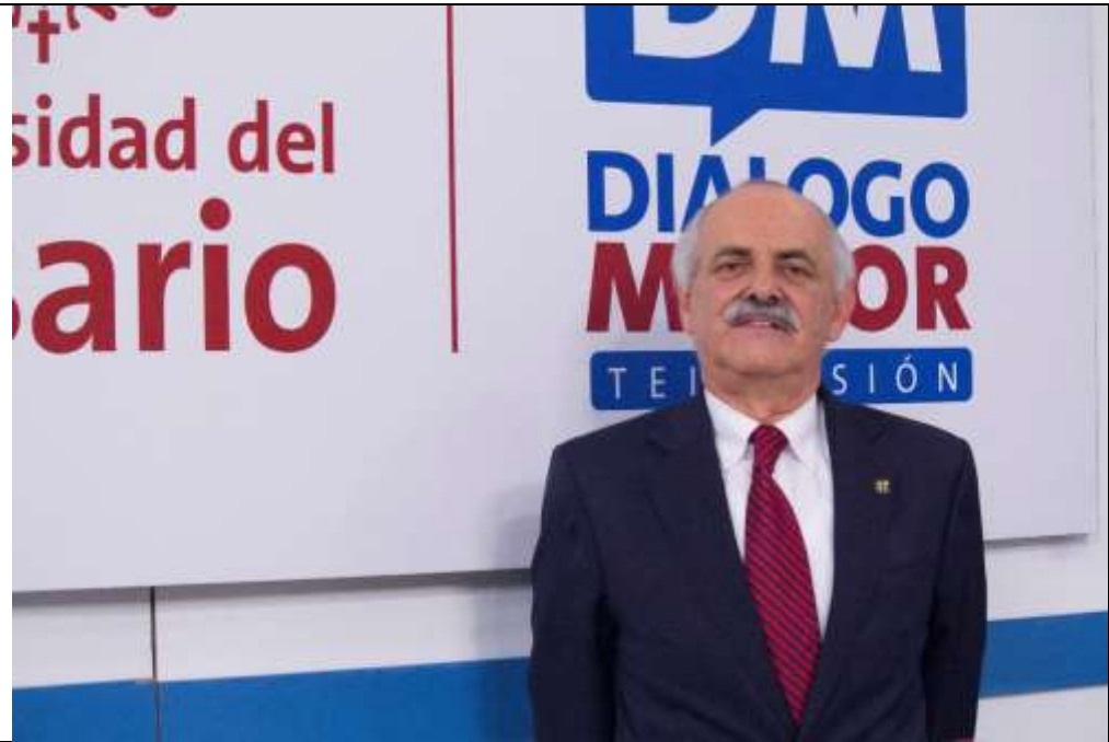
Foto del invitado