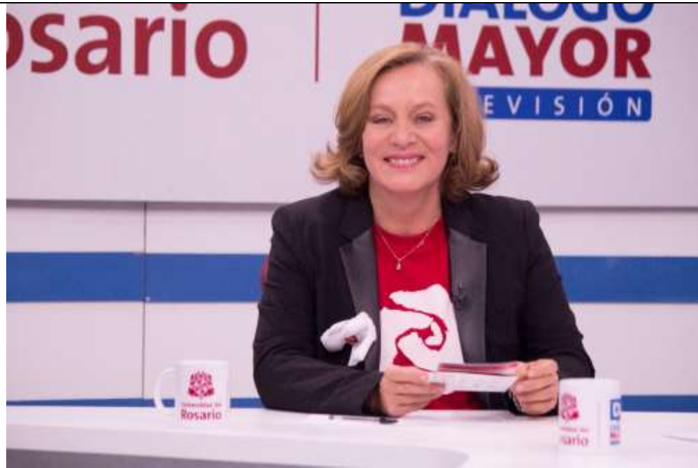
Foto del invitado