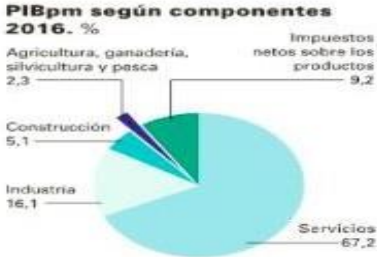
Gráfico N°3: PIB pm según componentes 2016. Este gráfico muestra los elementos de mayor influencia en la economía española, estos son servicios, industria, impuestos netos sobre los productos, construcción y por último agricultura, ganadería, silvicultura y pesca.